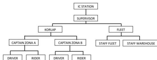
Gambar 2. Struktur Ninja Xpress Jasinga Bogor

Ninja Xpress merupakan layanan pengiriman barang yang mulai beroperasi sekitar tahun 2014. Berbasis di Asia Tenggara, perusahaan ini mengkhususkan diri dalam layanan pengiriman yang didukung teknologi canggih [7]. Ninja Xpress telah memperluas jaringannya dengan menjalin kerja sama bersama berbagai platform ecommerce besar, seperti Tokopedia, Lazada, dan lainnya, yang menjadikannya salah satu penyedia logistik utama.