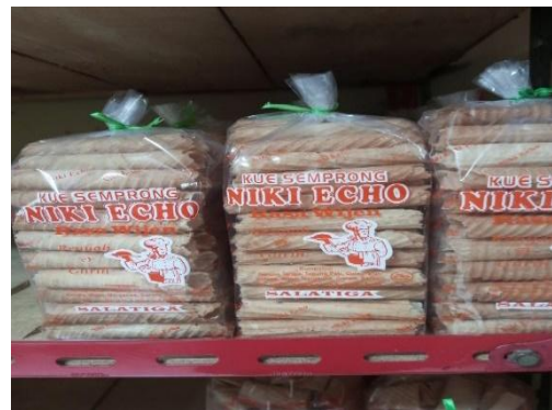
Gambar 2. Hasil Produksi Siap Dipasarkan