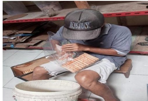
Gambar 3. Pendampingan Proses Produksi