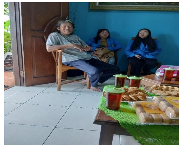
Gambar 1. Diskusi Permasalahan dan Pendampingan dengan Pemilik Usaha