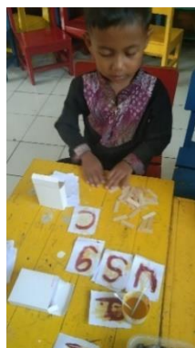
Gambar 4. Anak Bermain Media Secret Alphabet Berbasis Loose Part siklus II