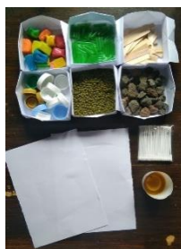
Gambar 1. Media secret alphabet berbasis loose part

Adapun media dan LKPD yang digunakan dalam penelitian ini dapat dilihat pada gambar berikut.