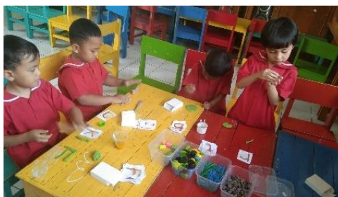
Gambar 3. Anak Bermain Media Secret Alphabet Berbasis Loose Part Siklus I

Tahapan pelaksanaan tindakan pada siklus I dilakukan pada 19 Mei 2025 di Kober Al-Urwatul Wutsqa, melibatkan 12 anak kelompok A. Pembelajaran bertema "Tanaman" dengan subtema "Tanaman Buah" sub-subtema "buah kesukaanku" berlangsung selama 180 menit, dimulai dengan pembiasaan pagi seperti membaca Iqro dan baris-berbaris. Kegiatan dilanjutkan dengan pendahuluan yang mencakup doa, lagu, dan pertanyaan pemantik seputar buah dan huruf awalnya. Pada inti pembelajaran, anak menggunakan media secret alphabet berbasis loose part untuk mengenal huruf. Setelah itu, anak mengerjakan LKPD secara bertahap sesuai kesiapan masing-masing. Usai kegiatan inti, anak beristirahat 30 menit, kemudian kegiatan ditutup dengan recalling dan refleksi. Pembelajaran diakhiri pukul 10.30 WIB.