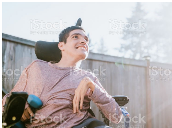
Gambar 3. Cerebral palsy: (Sumber: istockphoto.com, 16 November 2018)

Cerebral Palsy berasal dari kata cerebrum yang berarti sebuah perkataan dan otak , dan kekakuan yang bersumber dari kata palsy . Secara umum dapat diartikan menurut katanya cerebral palsy berarti kekakuan yang terjadi diakibatkan oleh syaraf didalam otak. Ini menjadi gambaran yang sangat luas pada stimulus auditory atau pendengaran, visual atau penglihatan, serta dalam konteks berbicara. Hal yang demikian ini menunjukkan bahwa kecerdasan yang dimiliki sangat kompleks seperti yang diungkapkan oleh Hordward Gerdner (1983), bahwa manusia memiliki kecerdasan ganda yang disebut Multiple Intelegence .