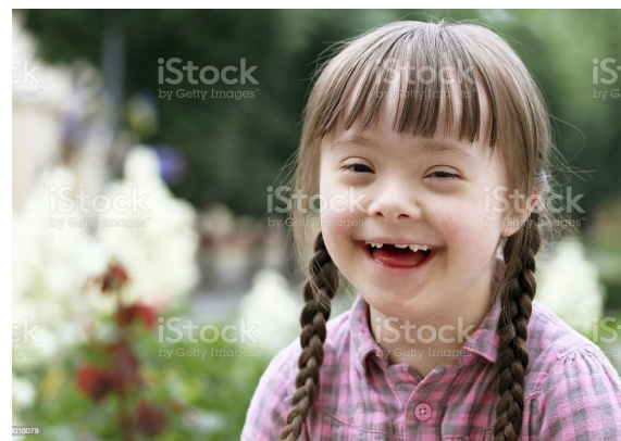
Gambar 1. Down Syndrome

Wiyani (2014, hlm, 113-114) dalam pandangannya menyebutkan terkait down syndrome ini terjadi karena adanya sebuah kelainan pada susunan kromosom yang ke 21, dari jumlah 23 kromosom pada manusia umumnya, berpasang-pasangan 23 kromosom tersebut hingga melengkapi menjadi jumlahnya yaitu 46 kromosom. Pada down syndrome, jumlah kromosom urutan yang ke 21 terdiri dari tiga trisomy , dengan demikian totalnya jumlahnya menjadi 47 kromosom. Tentu ini dianggap jumlah yang berlebihan dan mengaktifkan kegoncangan pada proses kekebalan tubuh (metabolisme sel) yang demikian ini lalu disebut dengan kemunculan down syndrome . Kosasih (2012, hlm. 76) juga melengkapi penjelasannya yakni terkait down sindrom adalah kondisi fisik dan mental seseorang anak yang diakibatkan adanya abnormalitas dalam perkembangan kromosom yang berada pada tubuh manusia yakni berupa serat-serat khusus yang terdapat pada setiap sel, dimana bahan-bahan genetik didalamnya terdapat karakteristik dan identitas seseorang. Dengan demikian dapat disebut bahwa identitas down syndrome ini memiliki ciri yang unik.