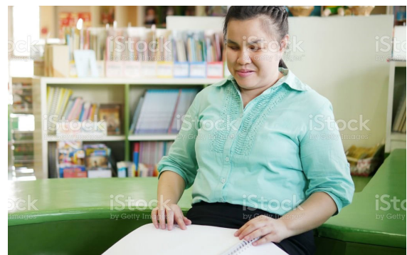
Gambar 5. Tuna netra

Berdasarkan klasifikasi diatas dapat disimpulkan sistem ini menjadi simbol komunikasi dalam budaya netra yang sangat menarik menjadi bahan pembelajaran buat masyarakat luas untuk lebih jauh memahami struktur kebudayaan yang dimiliki oleh tuna netra. Hal yang demikian ini menjadi modal untuk terjadi elaborasi dalam memahami keberagaman yang romantis, dimana sosial dan budaya adalah suatu perjuangan manusia yang disejajarkan oleh waktu dan alam, kesemuannya merupakan kejayaan masyarakat dan bukti dari kemakmuran Dewantara (1889 – 1959).