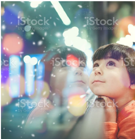
Gambar 2. Autisme

Autisme adalah gejala perkembangan yang timbul sebelum anak itu mencapai usia tiga tahun, yang juga disebut sebagai seseorang yang tidak dapat berinteraksi dan berkomunikasi secara efektif pada dunia luar selain dirinya (yayasan autism Indonesia). Karakteristik autisme secara fisik dan mental mempunyai sistem cara pandang dan hidup secara individu yang kecenderungannya dalam lingkungan sendiri sudut pandangnya yang demikian ini lalu mengisyaratkan pada dunianya yang berbeda. Kecenderungan perilaku ini terakumulasi pada kebiasaan dalam kehidupan sehari-hari yakni perilaku yang repetitif (berulan-ulang), senang dalam meniru sesuatu membeo ( ekolalia ), gaya bahasa dalam daya ungkap suara yang sangat abstrak seperti gerakan seni kontemporer yang tidak menggambarkan objek dalam dunia nyata, komunikasi yang demikian disebut juga sebagai komunikasi non verbal Rahardjdo (2016).