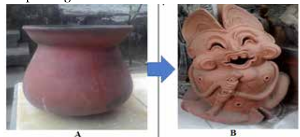
Gambar 1. Bentuk periuk sebelum diinovasi (A) dan bentuk sesudah diinovasi menjadi patung taman (B).

Berdasarkan hasil wawancara dapat dikatakan bahwa bentuk patung taman adalah hasil kreatifitas dari perajin itu sendiri, bila I Wayan Kuturan menciptakan bentuk patung taman dari sebuah periuk yang dibalik, sedangkan perajin lainnya membuat patung serupa dengan teknik cetak.