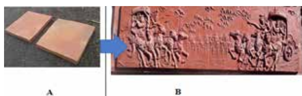
Gambar 3. Bentuk terakota sebelum diinovasi (A), dan

Relief terakota pertama kali dibuat oleh I Wayan Kuturan untuk memenuhi pesanan pembangunan Hotel di Nusa Dua. Terakota sebelumnya hanya berbentuk polos tanpa dekorasi namun sedikit peminatnya. I Wayan Kuturan kemudian mencoba menambahkan dekorasi cerita pewayangan pada terakota polos tersebut. Relief terakota yang sekarang diproduksi lebih banyak menampilkan cerita pewayangan. Saat pertama kali diproduksi untuk dekorasi hotel di Nusa Dua, menurut I Wayan Kuturan relief tersebut menceritakan kehidupan masyarakat Bali dari awal kehidupannya (lahir) sampai dengan akhir kehidupan (mati). Produk relief terakota dengan cerita pewayangan karya bapak I Wayan Kuturan yang masih bisa didokumentasikan yaiturelief terakota yang dipasang di gedung Kantor Desa Pejaten dan masih dapat dilihat sampai saat ini.