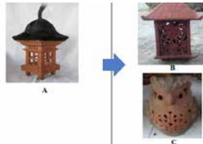
Gambar 5. Bentuk lampu taman berbahan kayu dan ijuk (A), bentuk lampu taman hasil inovasi perajin menggunakan bahan tanah liat meniru bentuk lampu taman berbahan kayu dan ijuk (B), dan lampu taman berbentuk burung hantu (C).

Lampu taman yang diciptakan mengambil bentuk dari lampu taman yang dibuat oleh perajin Bali menggunakan bahan kayu dan ijuk. Karena bahan ini tidak tahan lama maka perajin mulai berinovasi menggunakan bahan tanah liat. Lampu taman biasanya dibuat berdasarkan pesanan dari konsumen terutama dalam hal bentuk, sedangkan untuk dekorasi pembeli mempercayakannya pada perajin. Dekorasi yang banyak diterapkan adalah motif khas Bali.