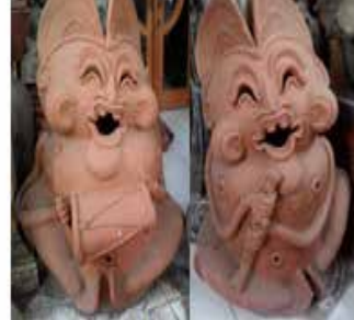
Gambar 6. Contoh jenis patung taman yang menampilkan nilai ceria dan gembira

kasar, gembira atau duka, suram atau ceria. Contoh produk yang menampilkan kesungguhan adalah produk patung Kuturan bermain musik tradisional yang menampilkan nilai gembira dan ceria, seperti pada gambar di bawah ini :