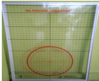
Gambar 1. Alat SG Posture Evaluation

Setelah data didapat data diuji dengan Pearson dan cronbach's alpha untuk mengetahui tingkat validitas dan reliabilitas. Alat ukur SG Posture Evaluation tertera pada gambar 1 dibawah ini