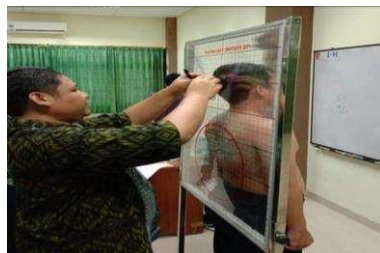
Gambar 2. Menggunakan alat SG Posture Evaluation