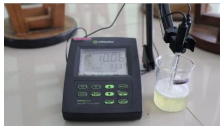
Gambar 3. pH sabun transparasi