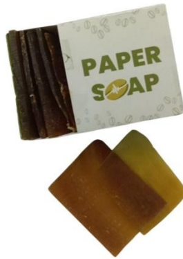
Gambar 1. Sabun transparasi