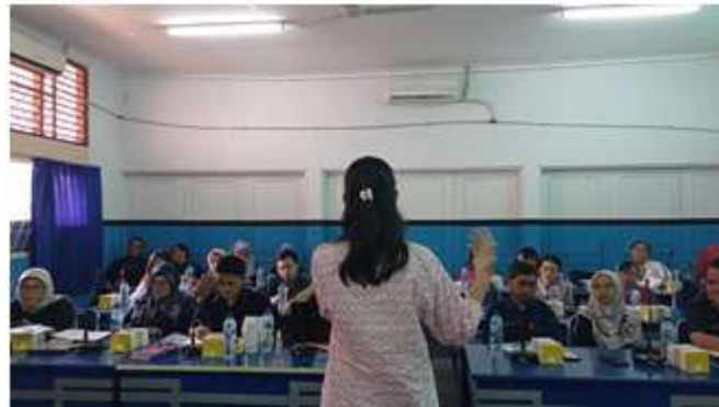
Gambar 2. Pelatihan Guru dari Komunitas Belajar SMAN 86 Jakarta