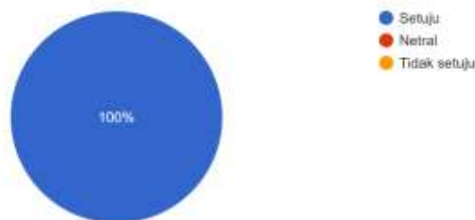
Diagram 3. Hasil survei mengenai materi pembelajaran diferensiasi

Webinar ini memberikan saya pemahaman yang lebih baik tentang pembelajaran berdiferensiasi di kelas saya. 20 responses