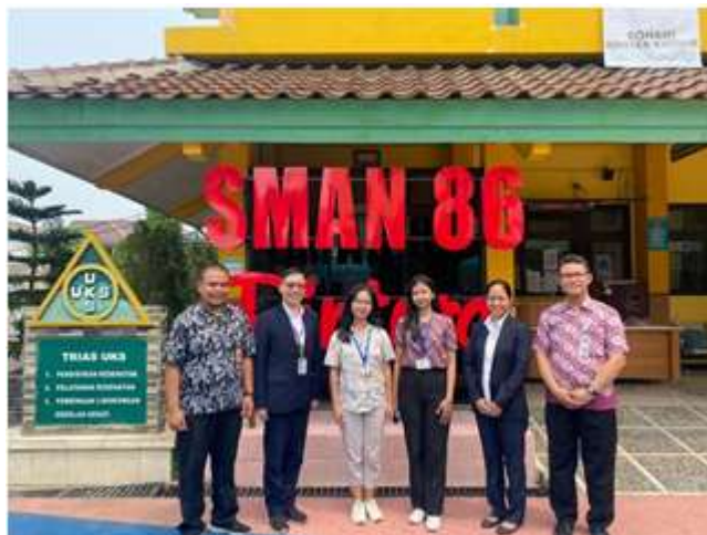
Gambar 1. Audiensi ke SMAN 86 Jakarta

Program pelatihan dan pendampingan In-House Training Implementasi Kurikulum Merdeka ini diharapkan dapat menjawab permasalahan yang dihadapi para guru dalam meningkatkan kompetensi inti sebagai pendidik sehingga dapat mempersiapkan diri dalam melaksanakan Kurikulum Merdeka di kelas sehingga dapat mendorong kemampuan siswa dalam pembelajaran mandiri, memaksimalkan potensi dan minat siswa, serta mewujudkan profil pelajar Pancasila yang mampu bersaing dalam menghadapi perubahan zaman.