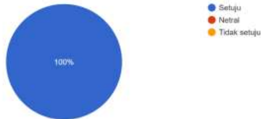
Diagram 1. Hasil survei mengenai relevansi materi dengan kompetensi guru

Materi yang dibawakan oleh pembicara relevan bagi peningkatan kompetensi saya sebagai seorang guru. 20 responses