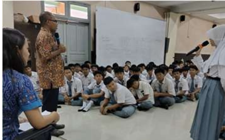
Gambar 3. Sesi Tanya Jawab

mengenai topik Pemimpin yang Berkualitas, di mana kegiatan pendampingan dan latihan terbimbing berlangsung selama 6 JP secara onsite dihadiri oleh para guru dan 40 siswa yang terpilih sebagai bagian dari Organisasi Siswa Intra Sekolah (OSIS) SMAN 86 Jakarta. Melalui seminar ini, diharapkan siswa mendapatkan pengetahuan dan keterampilan yang baik tentang pentingnya menjadi pemimpin yang berkualitas sehingga mereka dapat menjadi contoh yang baik bagi siswa lainnya. Selain itu, kegiatan ini juga mendorong para guru untuk dapat mengimplementasikan Kurikulum Merdeka tidak hanya dalam pembelajaran di kelas tetapi juga di luar kelas dalam kegiatan ekstrakurikuler yang diikuti siswa.