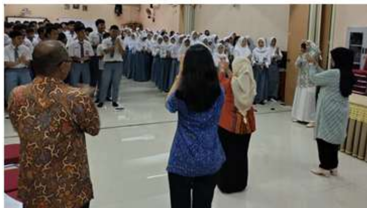
Gambar 2. Pendampingan Lanjutan – Topik Bhinneka Tunggal Ika

Kegiatan pendampingan lanjutan dilakukan pada hari Selasa, 16 Januari 2024 berfokus pada penguatan topik Bhinneka Tunggal Ika untuk persiapan pembuatan P5 melalui pelatihan dan latihan terbimbing kepada guru dan siswa selama 4 JP. Pendampingan ini dilaksanakan secara onsite dan dirancang untuk meningkatkan kesadaran serta pemahaman guru dan siswa tentang pentingnya keberagaman dalam konteks Pendidikan yang harus dimunculkan pada pembuatan P5 pada semester berjalan. Kegiatan ini diikuti oleh para guru dan siswa kelas 11 dari 6 paralel kelas sebanyak 200 lebih siswa SMAN 86 Jakarta.