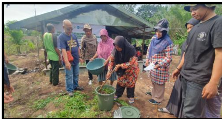
Gambar 4. Praktek pembuatan pupuk jadam dari gulma sekitar lahan petani

Petani memahami dengan pembuatan dan pemberian pupuk JADAM ini merupakan solusi dengan memanfaatkan mikroorganisme lokal sekitar lahan dalam mengurangi dampak kekeringan atau pemberian nutrisi tambahan terhadap tanaman sehingga akan berdampak positif terhadap hasil panen mendatang.