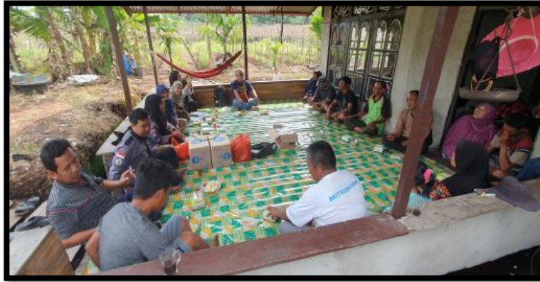
Gambar 3. Penyampaian Materi Penyuluhan Melalui Ceramah dan Diskusi Dengan Anggota Kelompok Tani Maju Makmur

mempunyai fungsi yaitu pengatur tata air, pengendali banjir serta menjadi ekosistem beberapa jenis makhluk hidup dan bermanfaat sebagai gudang penyimpan karbon dan berperan sebagai pengendali kestabilan iklim global (Agus dan Sri, 2019). Kelompok tani antusias dalam mendengarkan pengarahannya terhadap materi yang diberikan, kelompok Tani Maju Makmur juga telah terlibat dalam pemeliharaan restorasi lahan gambut dengan melakukan pembersihan terhadap lahan disekitar sekat kanal miliknya.