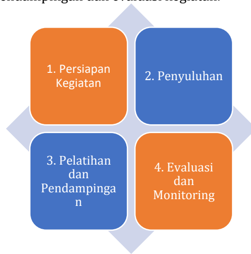
Gambar 1. Tahapan Pelaksanaan PkM Pembuatan Pupuk JADAM

Kegiatan pengabdian masyarakat dilaksanakan di Desa Limbung Kecamatan Sungai Raya, Kabupaten Kubu Raya pada bulan Oktober 2023. Mitra sasaran kegiatan ini adalah Kelompok Tani Maju Makmur. Adapun pelaksanaan kegiatan PkM pembuatan pupuk JADAM ini dilakukan dengan beberapa metode dengan tahapan yaitu persiapan kegiatan, penyuluhan, pelatihan, pendampingan dan evaluasi kegiatan.