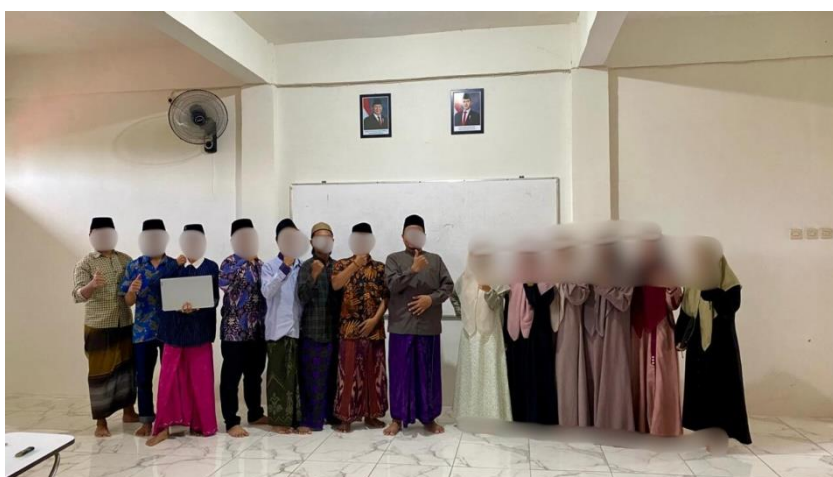
Gambar 5. Kegiatan Penutupan

Yang terakhir adalah sesi tanya jawab menjadi sarana penting bagi peserta untuk menggali lebih dalam persoalan teknis yang mereka hadapi selama ini. Kemudian kegiatan pelatihan ini diakhiri dengan foto bersama dan pemberian sertifikat kepada pemateri pelatihan.