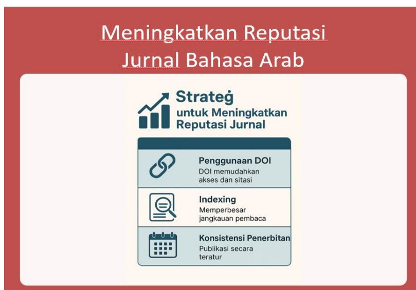
Gambar 4. Penyampaian Strategi untuk Meningkatkan Reputasi Jurnal

Yang terakhir adalah sesi tanya jawab menjadi sarana penting bagi peserta untuk menggali lebih dalam persoalan teknis yang mereka hadapi selama ini. Kemudian kegiatan pelatihan ini diakhiri dengan foto bersama dan pemberian sertifikat kepada pemateri pelatihan.