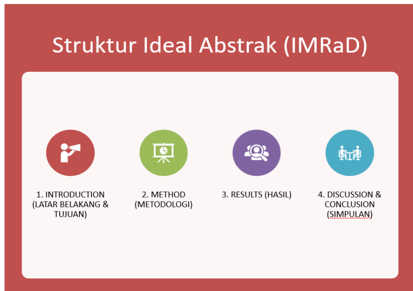
Gambar 2. Penyampaian Materi Artikel sesuai Struktur IMRaD.