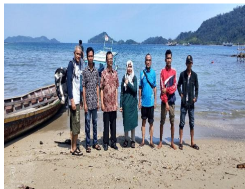
Gambar 3. Survey bersama tokoh pemuda.

Masyarakat yang dilibatkan dalam survey ini adalah masyarakat yang tahu dan mengerti tentang lokasi wisata dan pelaku wisata di Nagari Sungai Pinang (Gambar 3). Masyarakat Sungai Pinang sudah terlibat aktif usaha wisata bahari diantaranya adalah cottage, home stay, boat wisata, penyewaan alat selam dan pemandu wisata. Pendapatan terbesar dari usaha wisata bahari di Sungai Pinang adalah cottage, kemudian diikuti dengan usaha penyewaan alat selam [5].