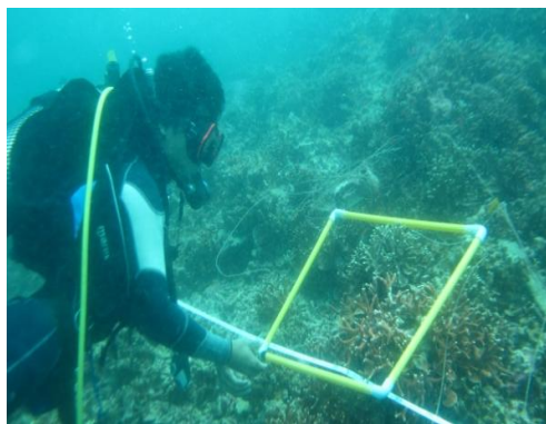
Gambar 5. Kondisi terumbu karang