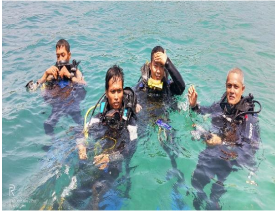
Gambar 4. Survey terumbu karang