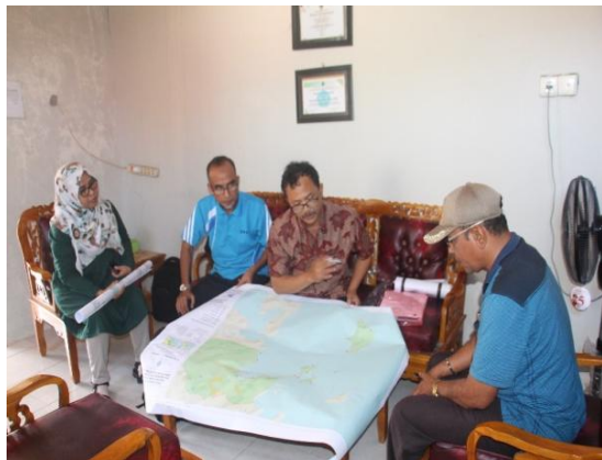
Gambar 6. Diskusi peta dengan tokoh pemuda dan Wali Nagari