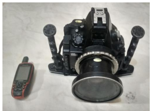
Gambar 2. Kamera Under water dan GPS

Masyarakat yang dilibatkan dalam survey ini adalah masyarakat yang tahu dan mengerti tentang lokasi wisata dan pelaku wisata di Nagari Sungai Pinang (Gambar 3). Masyarakat Sungai Pinang sudah terlibat aktif usaha wisata bahari diantaranya adalah cottage, home stay, boat wisata, penyewaan alat selam dan pemandu wisata. Pendapatan terbesar dari usaha wisata bahari di Sungai Pinang adalah cottage, kemudian diikuti dengan usaha penyewaan alat selam [5].