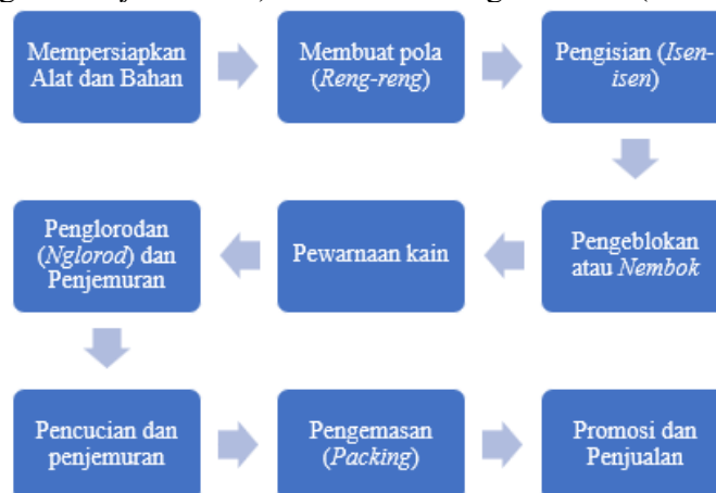
Gambar 1 Flowchart Proses Produksi Kain Batik Tulis

Tahapan pertama yang dilakukan yaitu proses pengumpulan data dan proses identifikasi ruang lingkup permasalahan dengan membentuk tim formasi ( team formation ) green productivity yang terdiri dari penulis, pemilik dan anak kandung dari Sanggar Batik Katura serta melakukan survei dan pendataan ( walk through survey ), berikut adalah alat yang digunakan, yaitu bagan alir ( flowchart ) dan keseimbangan bahan ( material balance ):