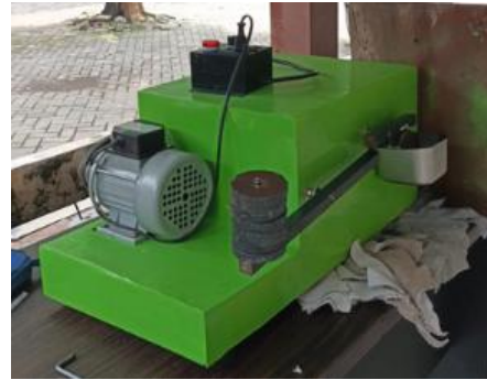
Gambar 1. Mesin Uji Abrasi

Mesin uji abrasi oli adalah alat yang dirancang untuk mensimulasikan kondisi gesekan dan keausan (abrasi) antara dua permukaan logam dalam kehadiran pelumas (oli). Mesin ini digunakan untuk menilai efektivitas pelumasan, laju keausan, serta kualitas pelumas dalam melindungi material terhadap kerusakan akibat gesekan.