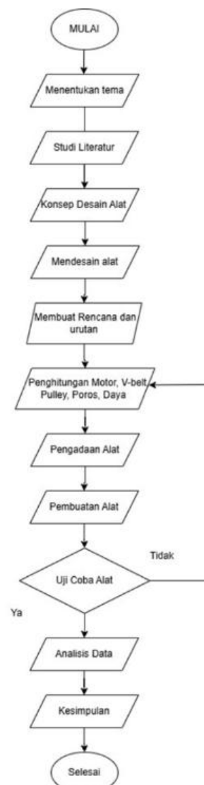
Gambar 2. Diagram Alir Penelitian

Penelitian ini menggunakan metode eksperimental untuk menganalisis karakteristik keausan abrasif material aluminium melalui pengujian laboratorium dengan parameter terkontrol. Pendekatan eksperimen dipilih karena mampu memberikan data