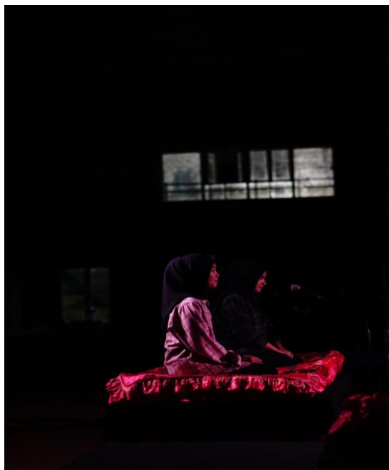
Gambar 3. Pertunjukan