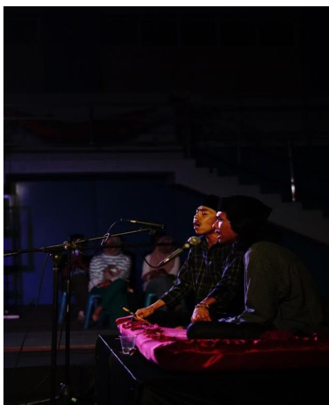
Gambar 5. Pertunjukan