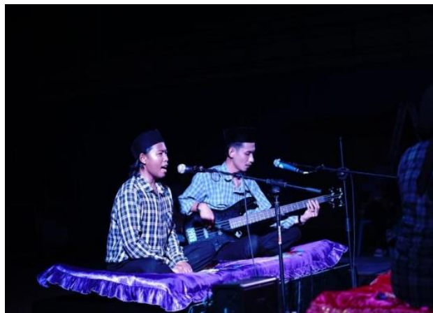
Gambar 2. Pertunjukan