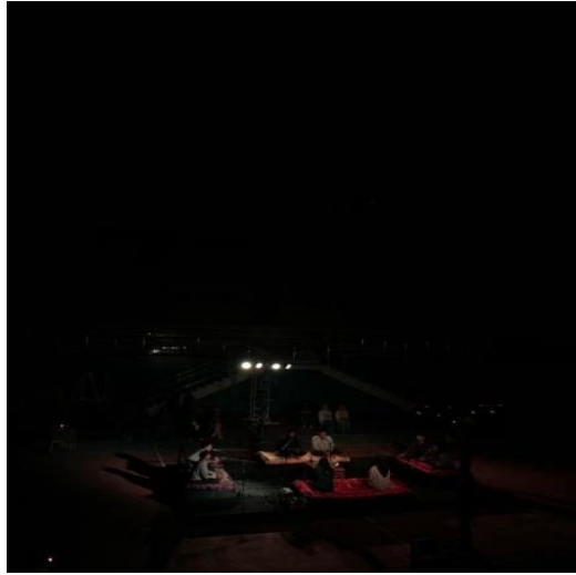
Gambar 1 Pertunjukan