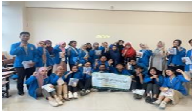
Gambar 1: Kegiatan PKM

Kegiatan pengabdian kepada masyarakat ini berlangsung dengan lancar dan mendapat respons positif dari para peserta. Mahasiswa Universitas Pamulang sangat antusias dalam mengikuti berbagai sesi yang diselenggarakan. Gambar 1 merupakan hasil pelaksanaan program berdasarkan tahapan kegiatan: