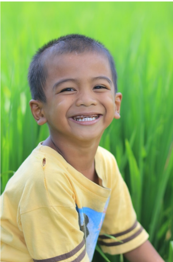
Gambar 4. Oheng , potret anak perkampungan dengan latar belakang persawahan.

banyak menghadirkan potret anak perkampungan dengan keterbelakangan dan keterpurukannya. Padahal bisa diciptakan karya foto yang menunjukkan bahwa anak di perkampungan dapat melakukan kegiatan positif dan maju, serta bersosialisasi dengan baik. Bahkan secara disiplin ilmu religi pun, banyak anak perkampungan memiliki ilmu agama yang maju dan tidak tertinggal, itu bisa dijadikan sumber ide penciptaan fotografi.