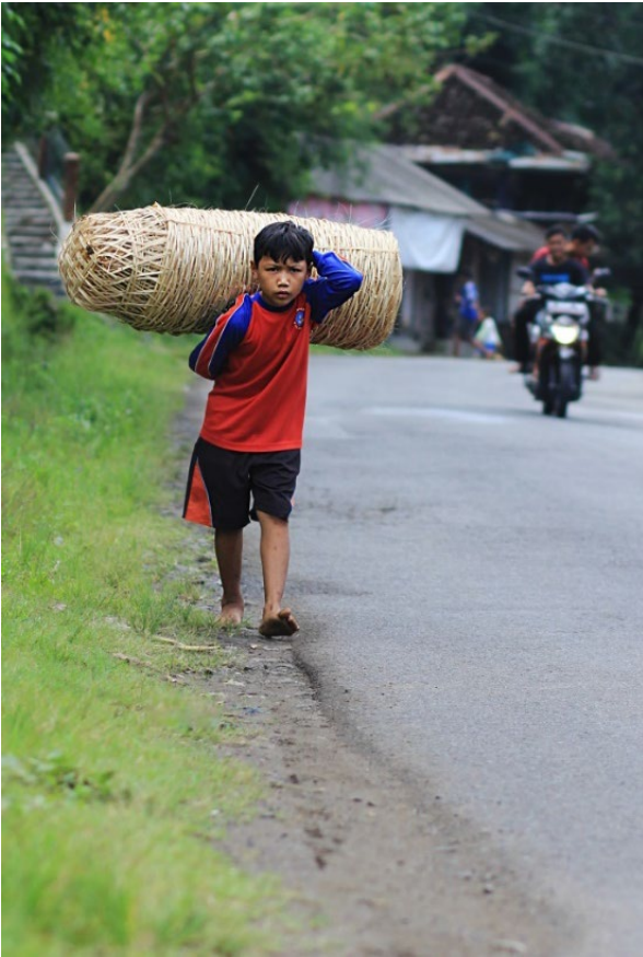
Gambar 12. Powerboy , beban berat di pundak anak. Cahaya matahari ( ambience light ) dimanfaatkan sumber penerang subjek. Foto dibuat dengan kamera canon 60D, Lensa 85mm, f/2.8 , 1/1000 detik, ISO-100. (Foto: Alysha, 22 Mei, 2018)

untuk subjek anak yang bergerak, karena teknik ini mudah dilakukan.