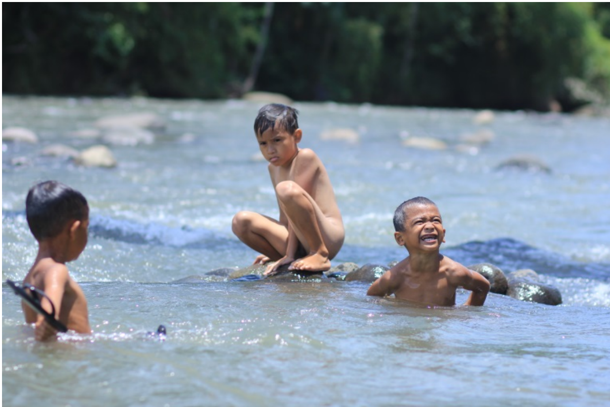
Gambar 3. Ngojay , atau berenang, salah satu aktivitas yang sering dilakukan anak di perkampungan yang dekat dengan sungai. (Foto: Alysha, 23 Februari 2018)

Indonesia. Dalam masyarakat di perkampungan terdapat anak-anak, remaja, orang dewasa, sampai lanjut usia yang dapat dijadikan subjek pemotretan. Brian Smith banyak mengambil potret orang dewasa dan orang tua yang ekspresinya sangat tajam dan kuat, sementara itu ada yang tidak kalah daya tarik visualnya, dan dapat dikatakan berbeda yaitu membuat karya fotografi dengan objek anak kecil dan segala kegiatannya. Arbus sendiri lebih banyak menonjolkan “foto unik dan aneh” pada setiap karyanya.