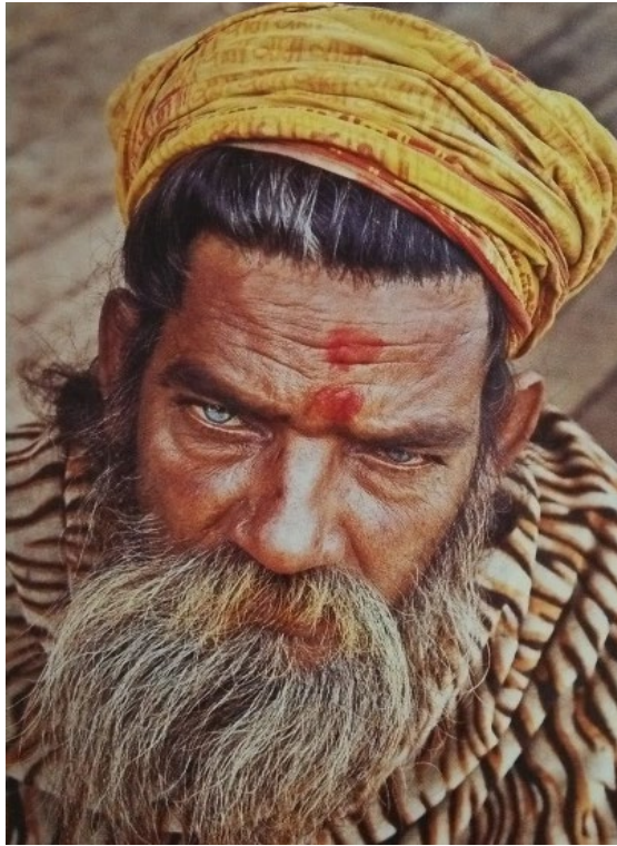
Gambar 1. Potret orang India karya Brian Smith dalam buku Secrets of Great Portrait Photograph .

wajah tajam, yang mencerminkan ciri khusus masyarakat Kathmandu.