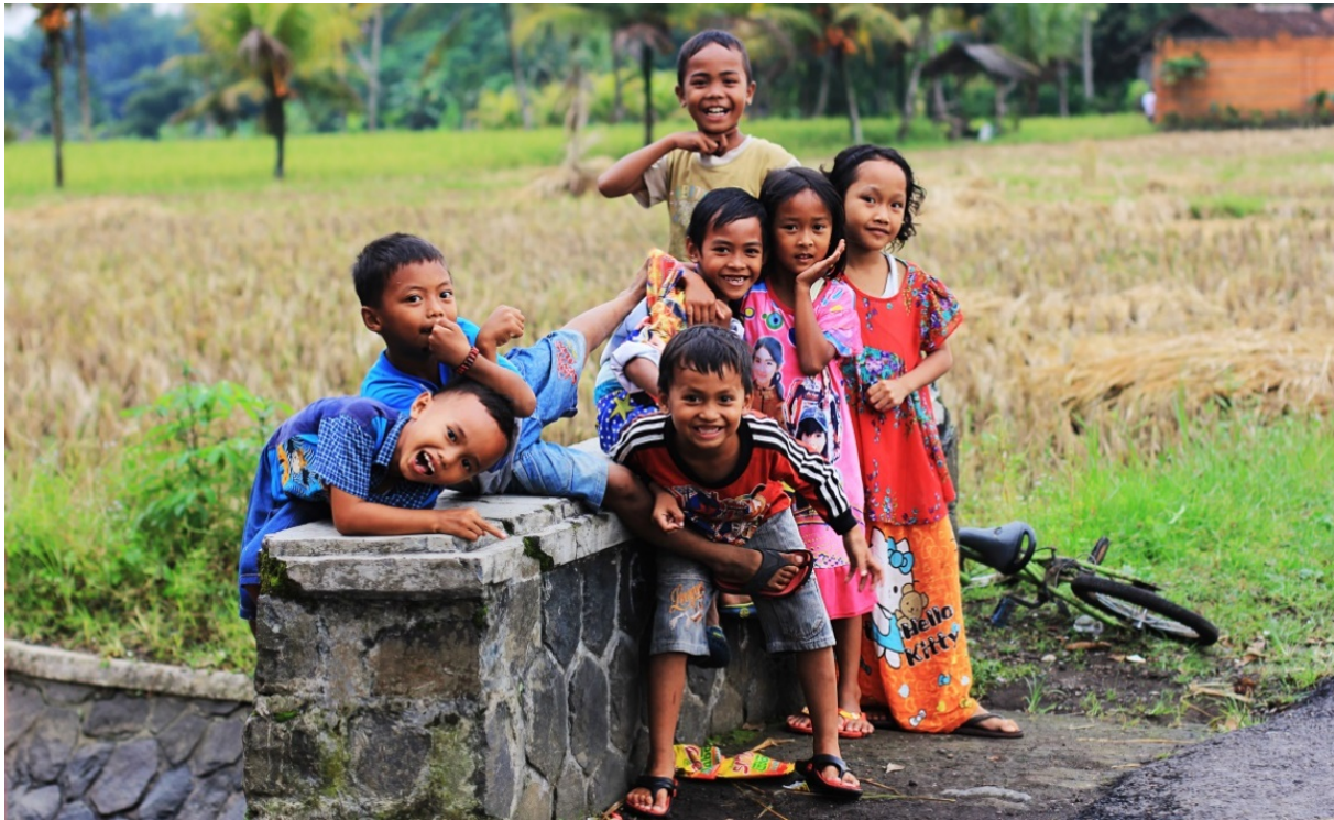
Gambar 9. Unity , teman sekampung berpose bersama, kebersamaan anak yang tetap lestari. Dibuat dengan kamera 60D dan lensa 50mm, f/2.8 , 1/100 detik, ISO 100, menghasilkan gambar tajam pada fokus utama.

setidaknya f/1.8 , akan menonjolkan objek dalam gambar lebih jelas, tajam, serta memiliki efek ruang tajam yang sempit yang sempurna.