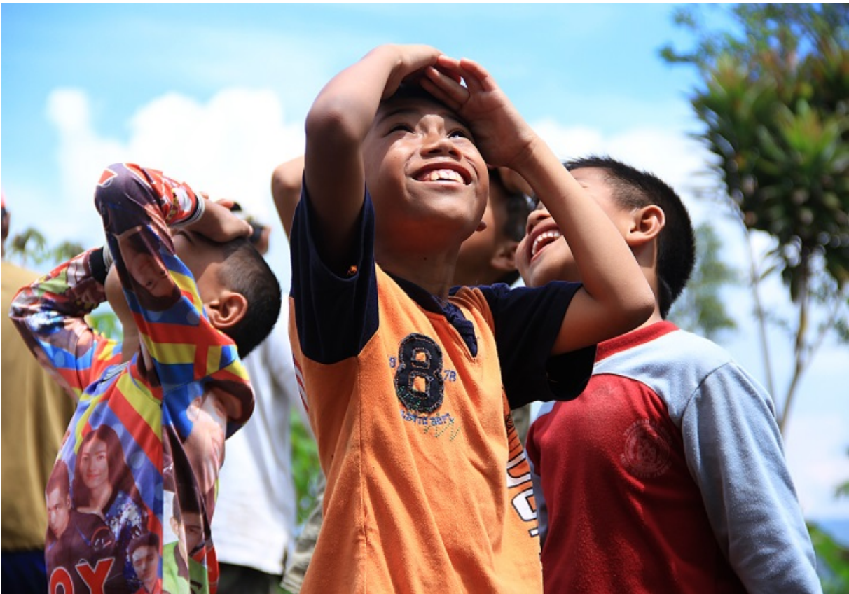
Gambar 8. Melihat Matahari, anak-anak yang dipotret dengan pemanfaatan key light. Cahaya matahari datang kurang lebih 30 derajat dari atas kepala.

Teknis penerapan fill light dalam memotret sering digunakan, jenis penyinaran ini digunakan untuk mengurangi atau bahkan mungkin menghilangkan sama sekali bayangan yang ditimbulkan oleh jenis penyinaran key light , dengan demikian fill light mampu menghilangkan segala efek yang ditimbulkan oleh key light tadi.