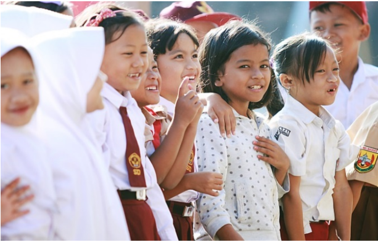
Gambar 6. Tetap Semangat , seorang anak sekolah dasar tanpa seragam mengikuti upacara bendera, tanpa harus malu.