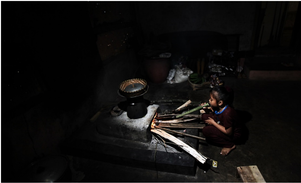
Gambar 14. Bulat Panjang , anak perempuan meniuap api di tungku pawon dengan selonsong bambu. Kondisi cahaya yang minim bukan halangan dalam memotret kegiatan anak. Foto dibuat dengan Canon 7D, f/4.5, 1/125 detik, ISO-500, lensa 10-18mm, focal length 10mm.