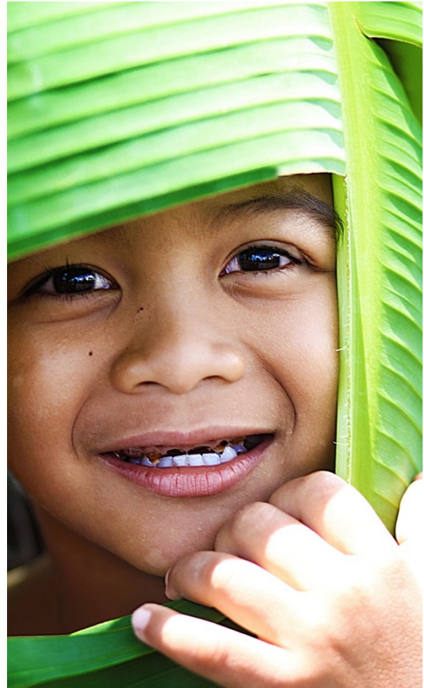
Gambar 11. Berbinar, seorang anak dengan mata bersinar, senyum merekah ekspresi paling tulus dari anak. Foto dibuat tanpa harus mendekati subjek, cukup zoom in dengan memutar gelang zoom 70-200mm di canon 60D, pada angka focal length 85mm, f/2.2, 1/320 detik, ISO 100.

atau mendekati subjek, tentu masalah ini bisa menimbulkan kerepotan, apalagi momennya yang tidak dapat diulang.