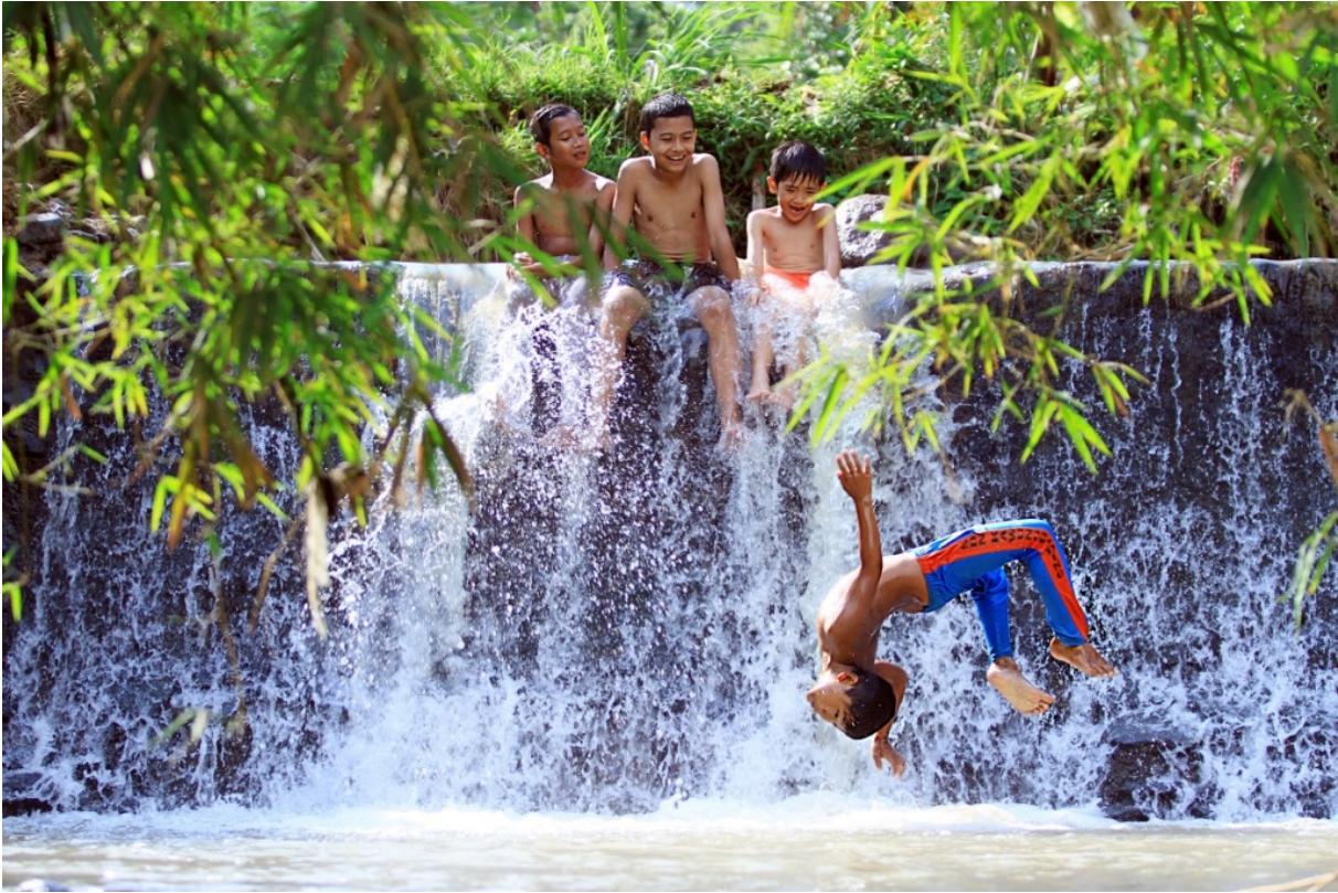
Gambar 13. Grafitasi berani , seorang anak salto di atas permukaan air. Teknik freezing dipakai untuk membekukan lompatan salto anak. Foto dibuat dengan kamera Canon 60d, f/2.8, 1/400 detik, ISO-100, lensa 70-200mm, focal length 70mm.