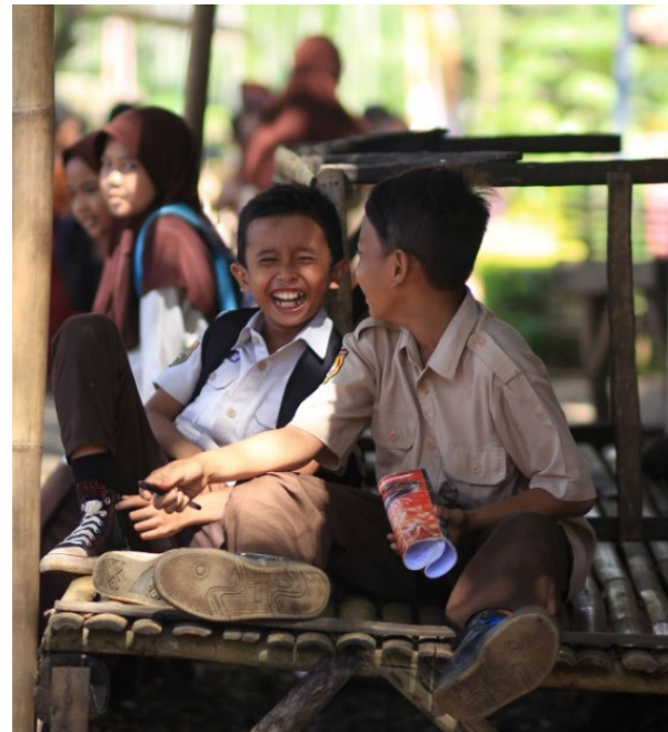
Gambar 5. Sosialita , berbincang ceria selepas sekolah, bentuk ekspresi kepribadian anak di perkampungan.

Aktivitas yang mereka lakukan hanyalah untuk kepentingan pribadi, jadwal yang padat, dengan begitu mereka tidak mempunyai waktu untuk bersosialisasi dengan tetangga dan lingkungannya, tidak jarang masyarakat yang tinggal di perkotaan tidak mengenal tetangganya sendiri. Hal ini sangat berpengaruh bagi anak, karena kebiasaan anak lebih banyak mencontoh kepribadian orang tuanya.