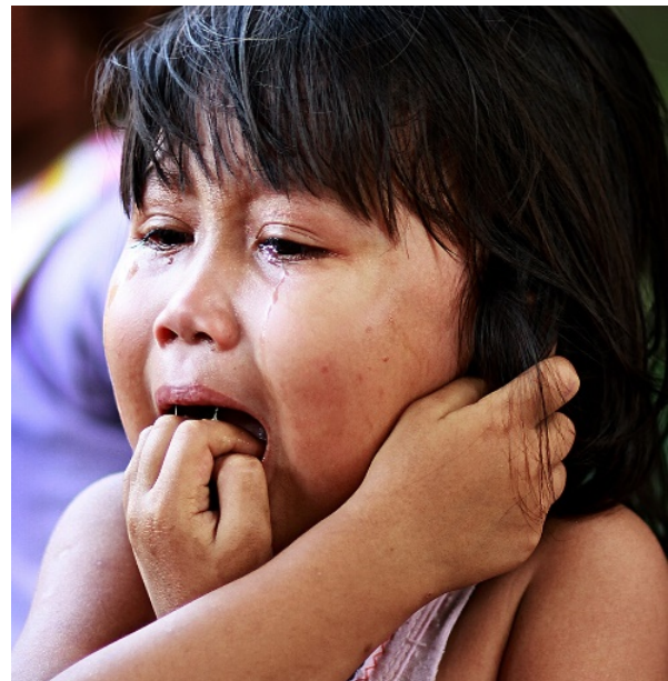
Gambar 15. Mengalir . Bentuk ekspresi tangis anak harus segera dipotret, karena emosi anak cepat berubah. Foto dibuat dengan Canon 7D, f/1.8, 1/125 detik, ISO-100, lensa 85mm.

Emosi sedih anak kadang terlupakan oleh fotografer, padahal emosi itu bisa saja membuat foto tampil beda dan kaya rasa. Perubahan emosi anak berlangsung cepat, dari tertawa, hanya akibat sesuatu yang kecil, bisa berubah menjadi menangis. Fotografer harus peka kondisi ini, cepat keluarkan kamera, memotretlah dengan segera, karena mungkin saja tangisnya cepat berhenti, lakukan dengan banyak 'klik' agar didapat hasil istimewa.