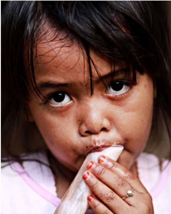
Gambar 10. Nikmatnya. Anak makan es lilin dibuat ber- type of shot: close up dengan canon 7D berlensa tele 85mm, f/2, 1/400 detik, ISO 100.

subjek anak yang jauh agar kelihatan lebih dekat dan detil, keunggulan lensa tele dalam pemotretan adalah ketajaman dan kecepatan fokusnya, karena kerja lensa jenis ini dapat memokus otomatis dengan sangat cepat, serta ketajamannya yang lebih akurat berbanding hasil foto dengan menggunakan lensa zoom .