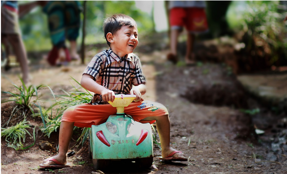
Gambar 16. Bukan Mobil, seorang anak asik bermain mobil-mobilan, seolah tidak mengetahui dirinya difoto, ini dapat dikatakan memotret dengan teknik kamera tersembunyi ( candid camera ).

tretan anak, tekniknya dengan membiarkan anak melakukan suatu kegiatan, tanpa arahan pose dari fotografer, dan fotografer tinggal membidik serta memilih action atau momen menarik untuk diabadikan dengan kameranya. Candid camera yang benar pun (pemotretan tanpa diketahui subjek) sangat dianjurkan dalam pemotretan anak.