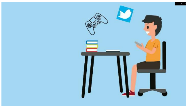
Gambar 1. Scane Seorang Anak yang Kecanduan Dengan Gawai