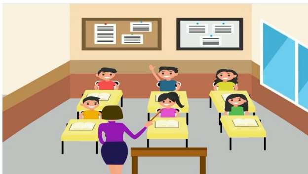
Gambar 2. Scane Seorang Anak yang Aktif di sekolah