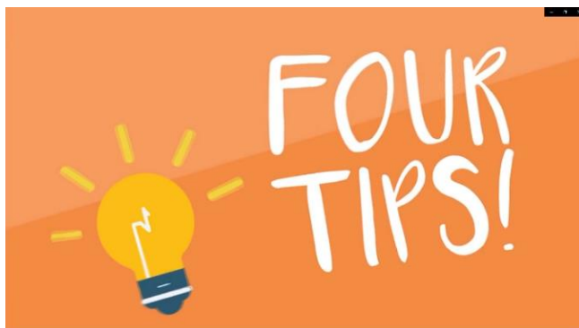
Gambar 1. Scane Tips Untuk Mengurangi Berlebihan Penggunaan Terhadap Gawai