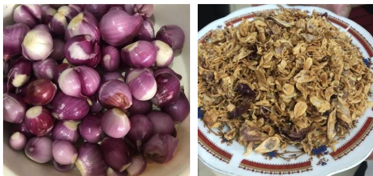
Gambar 8. Produk bawang merah goreng yang dihasilkan melalui pengolahan hasil pertanian setempat dengan menggunakan mesin pengiris bawang merah yang telah diberikan pihak universitas.