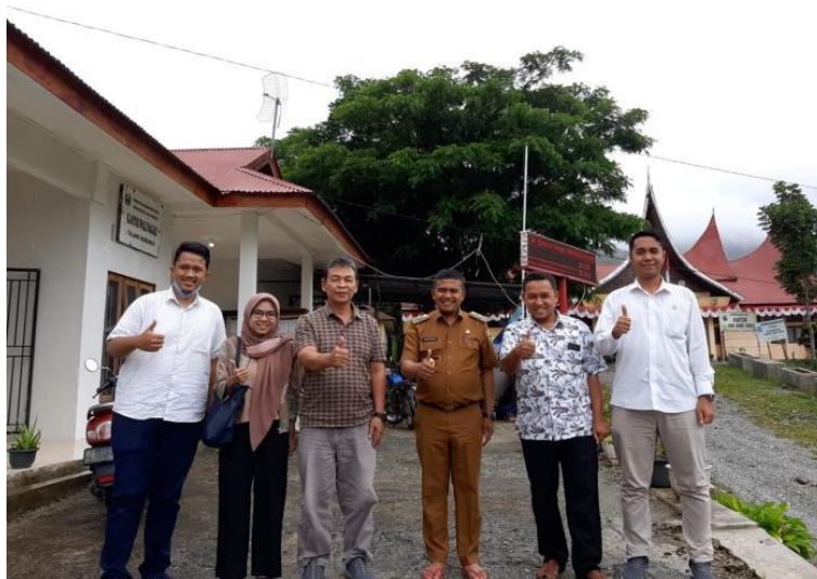
Gambar 2. Kegiatan survei dan diskusi dengan perangkat desa Kenagarian Talang Babungo, Kab. Solok, Sumatra Barat.

Perancangan dan pembuatan mesin pengiris bawang merah dilakukan berdasarkan hasil survei yang dilaksanakan pada petani dan pengusaha produk olahan bawang merah di Kenagarian Talang Babungo, Kabupaten Solok. Berdasarkan hasil survei yang dilaksanakan menunjukkan bahwa proses pengolahan bawang merah masih dilakukan secara manual atau alat sederhana dengan banyak keterbatasan, seperti ketebalan hasil potongan yang sulit diatur dan kapasitas produksi yang masih sedikit. Oleh karena itu, melalui kegiatan ini diharapkan masalah dan keterbatasan yang dialami oleh para pengusaha bawang merah dapat teratasi dengan baik. Kegiatan survei yang dilaksanakan diperlihatkan oleh Gambar 2.