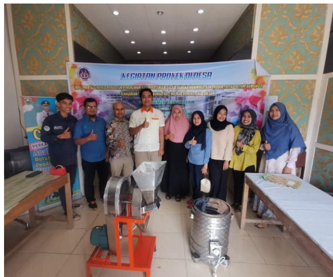
Gambar 5. Serah terima mesin pengiris bawang merah oleh Tim Pengabdian Teknik Mesin, Universitas Negeri Padang kepada salah satu pengusaha bawang merah dan perangkat desa Kenagarian Talang Babungo.

Pada kegiatan serah terima tersebut, pelatihan terkait cara penggunaan mesin pengiris bawang merah juga diberikan kepada pengusaha-pengusaha bawang merah di Kenagarian Talang Babungo. Kegiatan pelatihan penggunaan mesin pengiris bawang merah tersebut diperlihatkan pada Gambar 6. Selain itu, penjelasan terkait perawatan dan perbaikan mesin pengiris bawang merah juga diberikan agar nantinya dapat meningkatkan keterampilan pengguna dalam penggunaan mesin pengiris bawang merah tersebut.