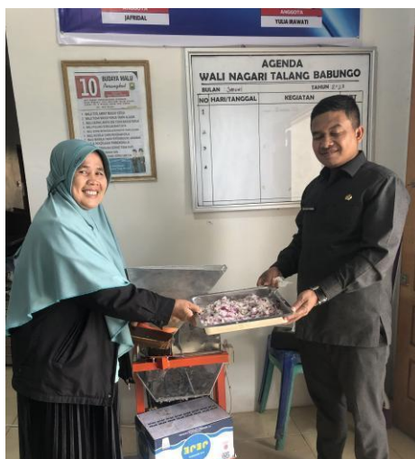
Gambar 7. Uji coba mesin pengiris bawang merah yang dilakukan oleh petani dan pengusaha bawang merah yang didampingi oleh perangkat desa di Kenagarian Talang Babungo.