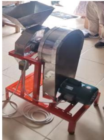
Gambar 4. Mesin pengiris bawang merah yang telah berhasil dirancang dan dibuat oleh Tim Pengabdian Teknik Mesin Universitas Negeri Padang.