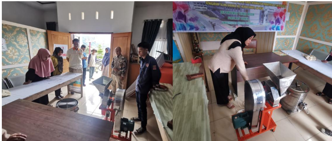
Gambar 6. Kegiatan pelatihan penggunaan mesin pengiris bawang merah.

melalui penggunaan mesin pengiris bawang merah tersebut, waktu pengirisan bawang merah menjadi lebih singkat. Sehingga, hal ini akan meningkatkan efektivitas kerja dan jumlah produksi produk bawang merah yang akan diolah. Produk olahan bawang merah goreng yang dihasilkan melalui proses pengolahan dengan menggunakan mesin pengiris bawang merah diperlihatkan pada Gambar 8.