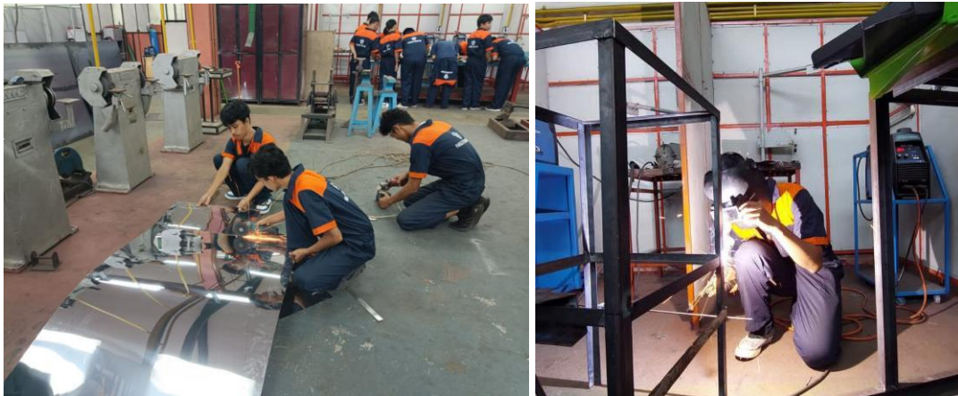
Gambar 3. Proses pembuatan mesin pengiris bawang merah oleh Tim Pengabdian dan mahasiswa Departemen Teknik Mesin.

Kegiatan perancangan dan pembuatan mesin pengiris bawang merah dilakukan di Workshop Permesinan, Departemen Teknik Mesin, Fakultas Teknik, Universitas Negeri Padang seperti yang diperlihatkan pada Gambar 3. Mesin pengiris bawang merah yang dirancang merupakan salah satu penerapan teknologi tepat guna dengan cara kerja mesin yang sederhana dan tidak rumit. Perancangan dan pembuatan mesin pengiris bawang dilakukan oleh Tim Pengabdian bersama mahasiswa Departemen Teknik Mesin selama \pm tiga bulan. Mesin pengiris bawang merah tersebut dibuat dengan menggunakan sumber daya yang mudah diperoleh dengan teknik pembuatan yang ada di lingkungan Departemen Teknik Mesin. Selain itu, mesin tersebut dibuat dengan teknologi yang mudah untuk dipelajari, dioperasikan, dan dipelihara oleh masyarakat yang akan menggunakan.