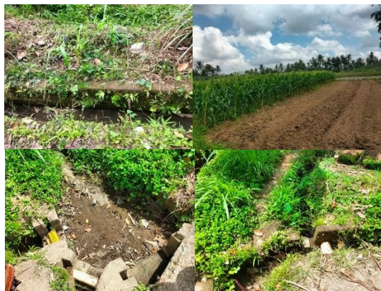
Gambar 2. Kondisi Subak Balangan dan Uma Tegal

Subak Balangan dan Subak Uma Tegal adalah subak yang terletak di Desa Kuwum, Kabupaten Badung. Kondisinya saat ini masih mengalami beberapa permasalahan ( Gambar 2 ).