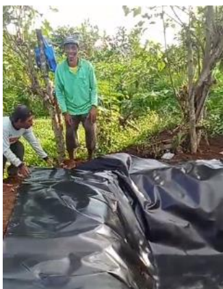
Gambar 6. Pemasangan geomembran