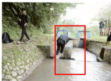
Gambar 3. Lokasi bangunan bagi Subak Balangan dan Subak Palean

Gambar 3 menunjukkan lokasi bangunan bagi yang merupakan titik distribusi air antara Subak Balangan dan Subak Palean. Di titik ini terdapat struktur tambahan yang dibangun di tengah saluran, menyebabkan penyempitan saluran yang memasok air ke Subak Balangan.