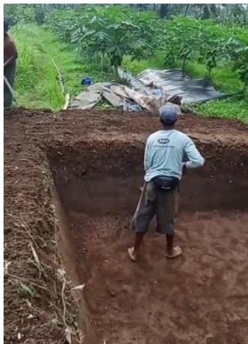
Gambar 4. Pembersihan lahan dan penggalian untuk pembuatan embung

proses pembersihan lahan dan penggalian, menjadi landasan penting bagi keberhasilan proyek tersebut dalam menyediakan sumber daya air yang berkelanjutan bagi masyarakat di sekitarnya.