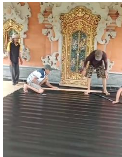
Gambar 5. Geomembran yang diberikan kepada Petani Subak Balangan Dan Uma Tegal

Selain itu, geomembran memiliki ketahanan terhadap korosi, minyak, zat asam, dan suhu tinggi. Material ini semakin populer karena harganya yang relatif lebih terjangkau dibandingkan dengan beton, sehingga menjadi alternatif menarik bagi para pemilik proyek untuk menggantikan lapisan beton atau memperbaiki beton yang mengalami kebocoran (PT Barca Karya Utama, 2024).