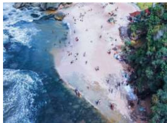
Gambar 1. Landscape Pantai Mesra

Penelitian ini dilakukan di daerah intertidal Pantai Mesra, Ngepung, Kemadang, Nawangan, Gunung Kidul, Daerah Istimewa Yogyakarta. Koordinat titik pengambilan sampel adalah 8.133538,110.553596 (gambar 1). Pengambilan sampel dilakukan pada tanggal 21 Oktober 2023, pukul 02.30-04.30 WIB pada saat air surut terendah.