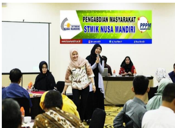
Gambar 1. Pembukaan materi

Dalam Pengabdian Masyarakat ini Hasil yang didapat adalah kemampuan peserta Pengabdian Masyarakat memahami pengaruh televisi sebagai akses informasi bagi Kelompok Swadaya Masyarakat (KSM) Kota Bekasi. Dilihat dari antusias dalam kegiatan ini, maka terlihat respon yang baik. Berikut merupakan dokumentasi mengenai pelaksanaan selama kegiatan berlangsung[12]: