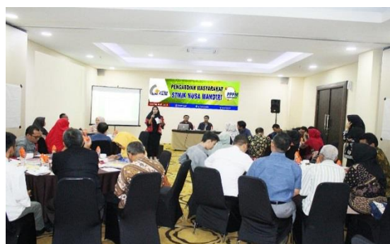
Gambar 3. Diskusi dengan peserta

Selama kegiatan berlangsung peserta bebas untuk bertanya mengenai hal bahasan dengan memberikan terlebih dahulu instruksi, seperti terlihat dalam gambar 2 yang mana ada salah satu peserta yang bertanya terkait dengan pembahasan.