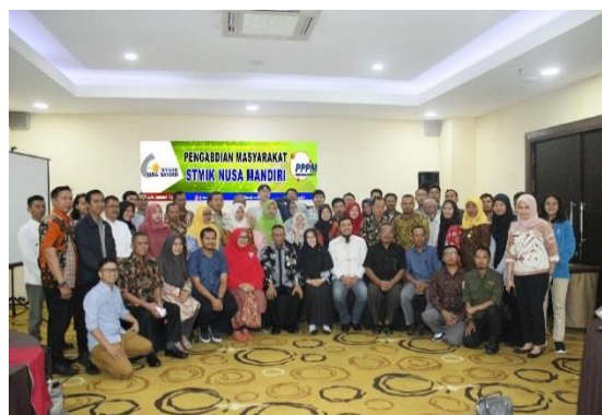
Gambar 4. Dokumentasi bersama

Kemudian terlihat pada gambar 3 yang mana kegiatan ini juga merupakan tempat diskusi tentang pemanfaatan aplikasi bagi masyarakat sekitar juga sehingga diharapkan apa yang dilakukan yang menggunakan internet dapat digunakan dengan bijak dan dapat bermanfaat dengan cara yang baik.