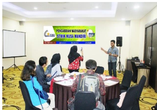
Gambar 2. Tanya Jawab dengan peserta

Sebagai dosen kita pun bertanggung jawab untuk memberikan pelatihan dan penyuluhan dalam rangka melaksanakan tri dharma perguruan tinggi, yang salah satunya dengan melakukan kegiatan pengabdian masyarakat.