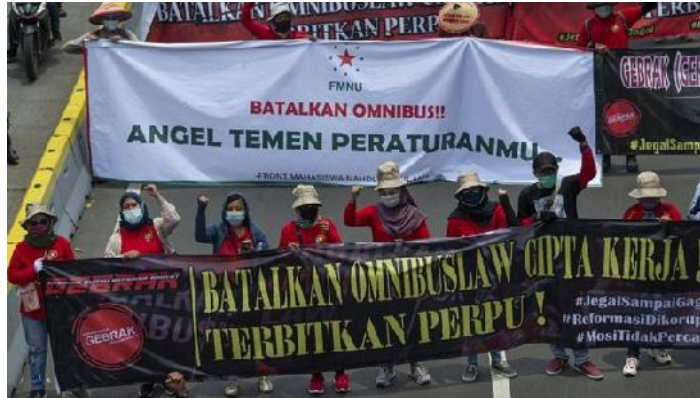
Gambar 1.2 Aksi Demo