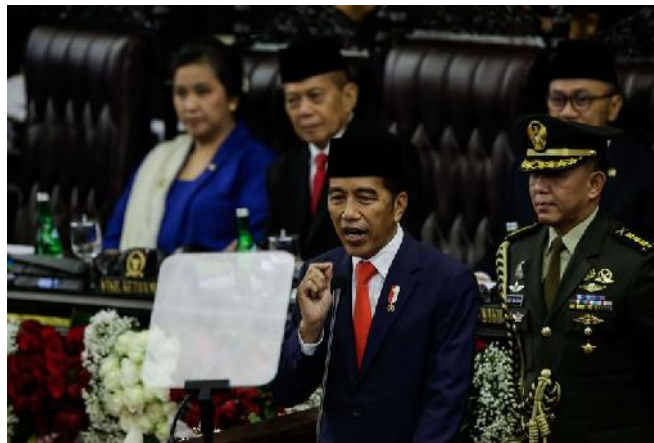
Gambar 1.1 Pidato Presiden Jokowi