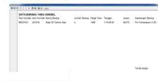
Gambar 6. 2.5 Menu Cetak Order

Menghasilkan dokumen cetak untuk keperluan administrasi dan pengadaan.