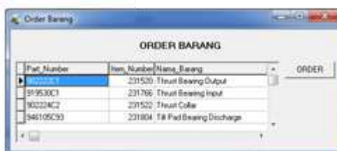
Gambar 5 Menu Order Barang

Digunakan untuk membuat pesanan pembelian kembali spare part yang stoknya berada di bawah batas minimum.