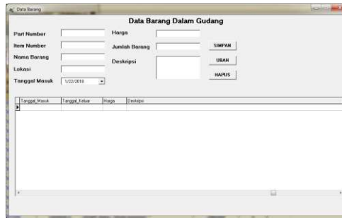
Gambar 3. Menu Barang Keluar