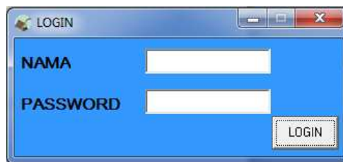
Gambar 2 Login

Berfungsi sebagai kontrol keamanan untuk memastikan hanya pengguna berwenang yang dapat mengakses sistem.