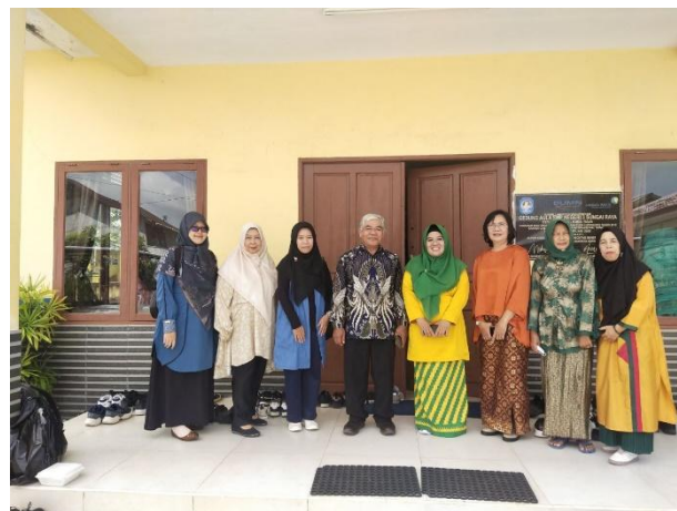
Gambar 4. Foto bersama Kepala Sekolah dan Guru

Pengabdian Kepada Masyarakat (PKM) yang diselenggarakan di SMP Negeri 3 Sungai Raya dan diikuti oleh sekitar 100 peserta. Penyambutan yang diberikan oleh sekolah sangat luar biasa, dewan guru sangat senang dengan adanya sosialisasi yang diadakan oleh Dosen Perguruan Tinggi.