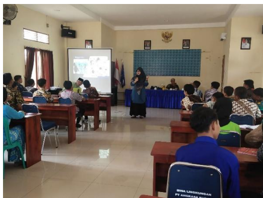
Gambar 3. Penyampaian Materi oleh Pemateri Kedua

Acara sosialisasi ditutup oleh Ketua Tim PKM. Kemudian disambung dengan acara sesi foto bersama baik dengan para siswa dan guru serta Kepala Sekolah. Acara berlangsung sangat meriah dengan sambutan para guru dan para siswa. Pihak SMP juga sangat senang karena ada edukasi dari pihak Perguruan Tinggi untuk melakukan sosialisasi tentang “Stop Tawuran”. Maraknya media dan pergaulan di kalangan remaja, rentan sekali adanya tawuran.