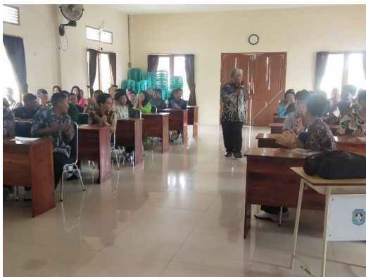
Gambar 2. Penyampaian Materi oleh Pemateri Pertama

Tawuran ini sangat merugikan bagi kita semua. Terutama kalau kita mengalami cedera yang permanen. Seperti kaki kita terluka saat tawuran dan mengalami cedera sampai tidak bisa berjalan dengan normal. Bayangkan saja saat kalian akan melakukan pernikahan, saat kita melamar pekerjaan. Sang Bapak mempraktekkan jalan dengan kaki yang sudah tidak normal lagi. Sang anak sontak tertawa dan mengangguk kepala. Itu masih masih cedera di bagian tubuh yang kelihatan, mental juga akan merasakan sepanjang hidup kalian. Saat tawuran akan meninggalkan bekas rasa bersalah dan penyesalan.