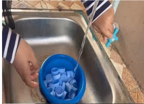
proses pencucian tutup botol

Pemanfaatan limbah dilakukan melalui beberapa langkah, yaitu pengumpulan, pemilahan, pembersihan, perancangan, perakitan, dan pewarnaan. Tutup botol plastik digunakan sebagai bahan utama untuk membuat vas bunga karena kekuatannya dan kemudahan dalam perakitan. Sementara itu, styrofoam digunakan sebagai bahan untuk membuat bunga dekoratif karena bobotnya yang ringan dan kemudahan dalam membentuknya. Proses ini menunjukkan bahwa limbah domestik non-organik dapat diproses secara kreatif melalui tahap-tahap yang sederhana.