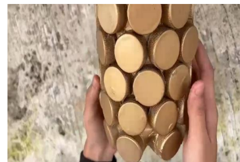
Proses pewarnaan vas bunga