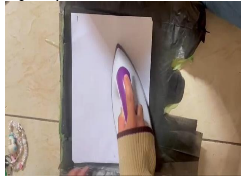
Proses setrika plastik