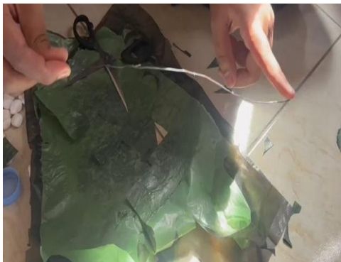
Proses pelilitan plastik ke besi untuk batang bunga