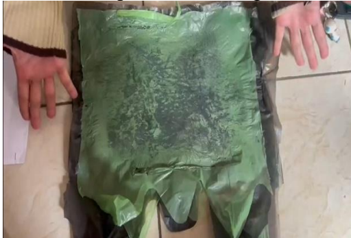
Proses pemotongan plastik untuk daun