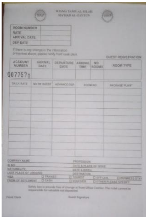
Gambar 3 Contoh Kuitansi Pembayaran di Penginapan Wisma Tamu Al-Ishlah

Berbeda dengan penginapan yang lain, penginapan Wisma Tamu Al-Ishlah memiliki kelebihan yang diberikan untuk tamu yang akan menginap. Sebagaimana yang disampaikan oleh bapak Yunus terkait dengan pembayaran sewa kamar, pada saat ini penginapan hanya menerima pembayaran dalam bentuk cash bisa dibayarkan dibagian resepsionis pada saat memesan kamar/check in, deposite (Membayar setengah harganya diawal, dan dilunasi pada saat check out), bisa juga dibayar pada saat check out (Yunus, 2024). Untuk perbedaan pembayaran jika tamu tersebut merupakan civitas Ma'had yang masih menerima gaji selama kerja bisa dengan cara memotong gaji. Sebagaimana yang disampaikan oleh bapak Hartono bahwa untuk tamu yang merupakan civitas Ma'had yaitu guru, karyawan dan dosen yang bekerja, masih menerima gaji dari Ma'had. Maka diperbolehkan melakukan pembayaran dengan cara potong ihsan/gaji (Hartono, 2024).