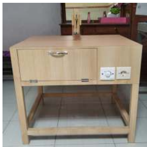
Gambar 1.1. Workstasion Proses Pemotongan Kain