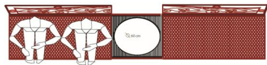
Gambar 2. posisi ergonomic di bangku taman kota tua Cirebon dengan perhitungan zona kepadatan rendah

Standar ergonomic dan antropometri dari bangku jalan di sesuaikan dengan standar yang ada di dunia. Standar duduk di area umum dengan zona sirkulasi kepadatan rendah, karena bangku jalan memang di gunakan sebagai sarana istirahat yang nyaman mungkin sehingga zona yang di pakai yakni zona dengan sirkulasi terluas.