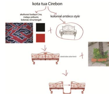
Gambar 1. Mind mapping desain bangku jalanan di kota tua Cirebon

Jalanan diilhami dari perpaduan antara akulturasi kebudayaan yang ada di Cirebon di wakili oleh batik Megamendung dengan gaya colonial art deco yang merupakan gaya yang tengah di minati di abad ketika kota tua Cirebon didirikan.