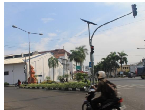
Gambar 5. Posisi dari arah jl. Yos Sudarso ke arah jl. Pasuketan

Berdasarkan foto diatas, wayfinding dinilai kurang tepat karena pengendara awam sulit membaca wayfinding yang terletak di depan gedung BAT. Hal-hal yang dinilai kurang dari wayfinding tersebut: