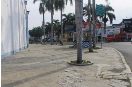
Gambar 6. Posisi dari arah jl. Kebumen ke arah jl. Pasuketan

Apabila wayfinding tersebut dilihat dari jl. Kebumen (Foto B), kurang terbaca, karena wayfinding mengarah ke jl. Yos Sudarso. Harus jalan belok dulu ke jl. Pasuketan agar wayfinding dapat terbaca.