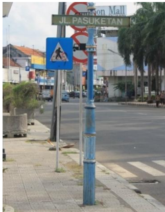
Gambar 7. Tiang petunjuk jalan Pasuketan

Apabila wayfinding tersebut dilihat dari jl. Kebumen (Foto B), kurang terbaca, karena wayfinding mengarah ke jl. Yos Sudarso. Harus jalan belok dulu ke jl. Pasuketan agar wayfinding dapat terbaca.