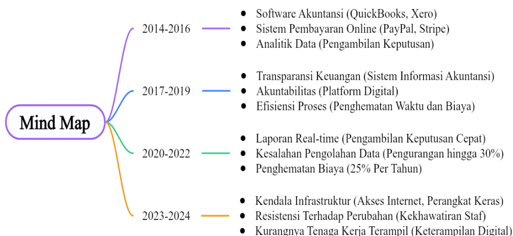
Gambar 2. Perkembangan Variabel Riset sesuai dengan topik penelitian

Ketidakpastian dan kekhawatiran staf mengenai kemungkinan kehilangan pekerjaan menciptakan resistensi terhadap perubahan, yang dapat memperlambat atau bahkan menghalangi implementasi sistem digital. Manajemen yang cenderung mempertahankan metode tradisional juga berkontribusi terhadap tantangan ini, karena mereka mungkin tidak melihat potensi keuntungan dari sistem baru.