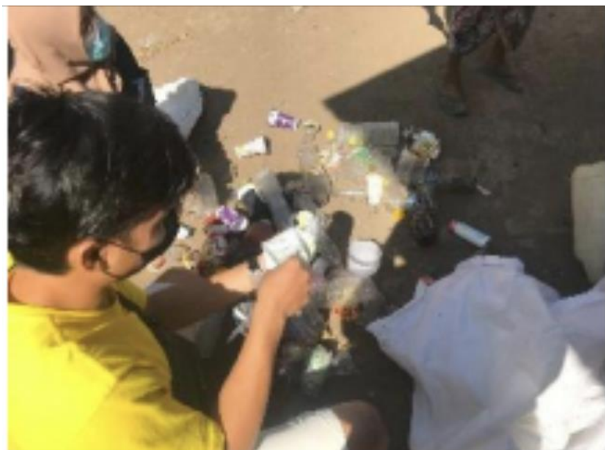
Gambar 1. Proses Daur Ulang Sampah