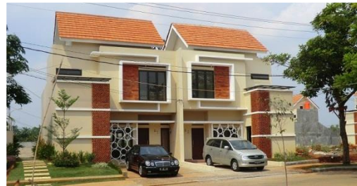
Gambar 1. Rumah 2 unit

Lokasi berada di Perumahan Bumi Dirgantara Permai Kota Bekasi Provinsi Jawa Barat