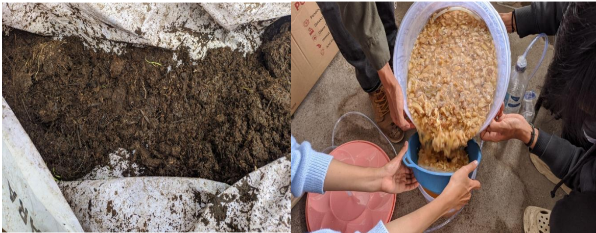
Gambar 2. Hasil pupuk kompos dan pupuk organic cair (POC)

Berdasarkan pemantauan dan pengamatan kami selama berlangsungnya program kerja ini dapat disimpulkan bahwa perhatian masyarakat desa Bayan terhadap materi penyuluhan yang disampaikan cukup tinggi. Hal ini dapat dilihat dari banyaknya pertanyaan yang diajukan oleh masyarakat yang ikut dalam kegiatan penyuluhan. Pertanyaan yang diajukan bukan hanya menyangkut bagaimana proses pembuatan pupuk kompos dan pupuk organik cair. Dimana contoh pertanyaan yang diajukan oleh satu warga yaitu bagaimana pengaplikasian pupuk kompos ini pada tanaman jagung, tanaman buah-buahan dan lainnya. Sebelumnya belum adanya pemahaman dan praktek kepada masyarakat akan pemanfaatan limbah rumah tangga dalam membuat pupuk kompos dan pupuk organik cair di desa Bayan. Penyuluhan dan praktek ini diharapkan dapat memberikan wawasan ke masyarakat dan memanfaatkan limbah rumah tangga salah satunya seperti kompos yang tentunya sangat berguna bagi tanaman