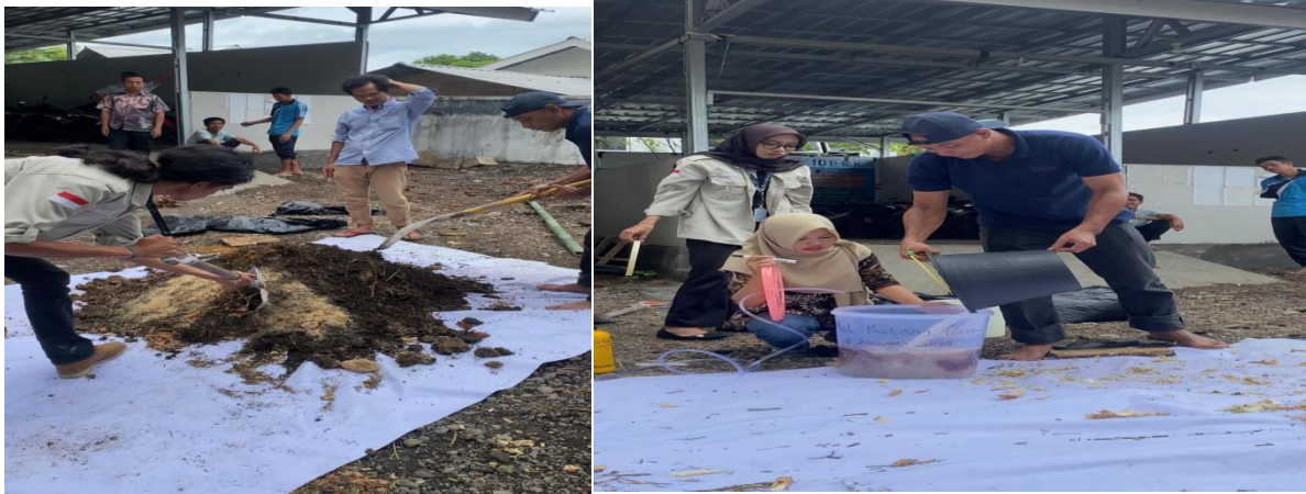
Gambar 1. Proses Pembuatan Pupuk Kompos dan Pupuk Organik Cair