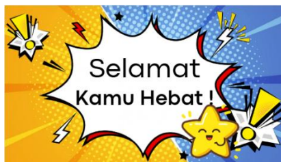
Gambar 4.27 Sebelum Revisi Halaman feedback Selesai Bermain