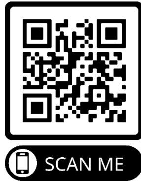
Gambar 4.1 Barcode Produk Pengembangan

https://www.canva.com/design/DAGbTmcPIH4/Hi7Ok3QKDenk21D3B1Vrgw/edit?utm_content=DAGbTmcPIH4&utm_campaign=designshare&utm_medium=link2&utm_source=sharebutton