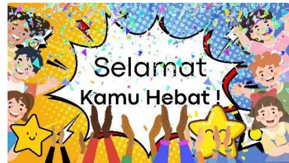
Gambar 4.28 Setelah Revisi Halaman feedback Selesai Bermain