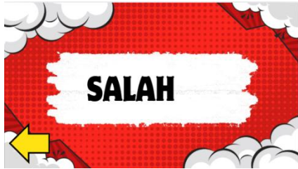
Gambar 4.25 Sebelum Revisi Halaman feedback Salah