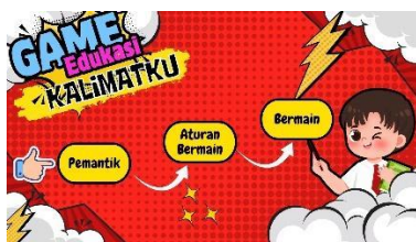
Gambar 4.21 Sebelum Revisi Pemantik