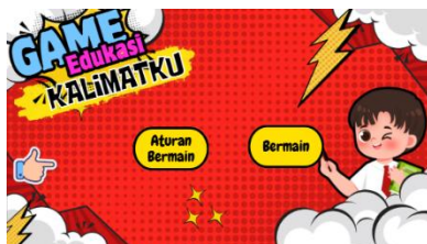
Gambar 4.19 Sebelum Revisi Halaman Utama