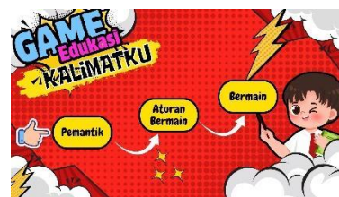
Gambar 4.20 Setelah Revisi Halaman Utama