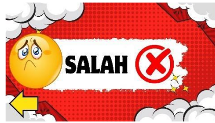
Gambar 4.26 Setelah Revisi Halaman feedback Salah