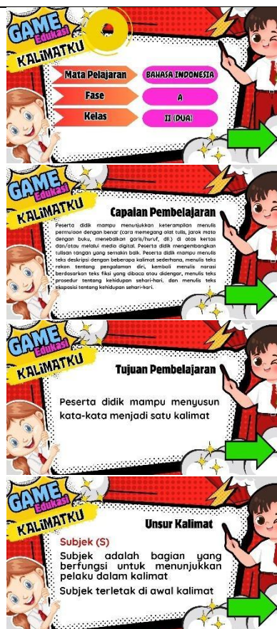
Gambar 4.22 Setelah Revisi Pemantik