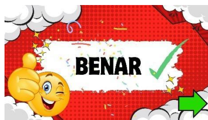
Gambar 4.24 Setelah Revisi Halaman feedback Benar