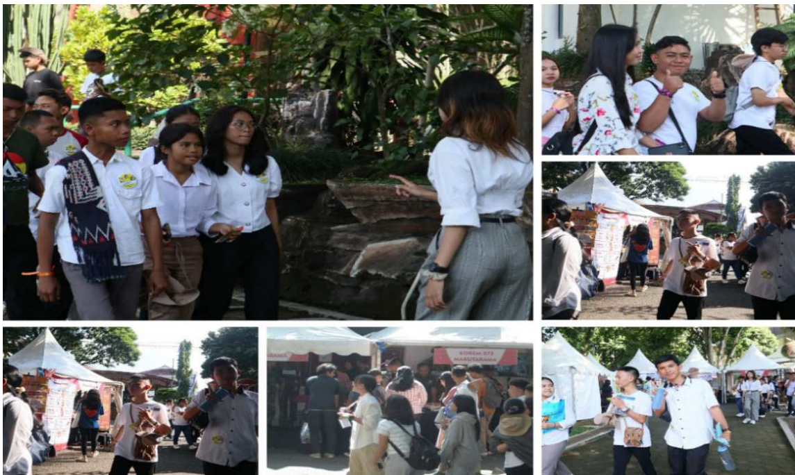
Gambar 6. Sesi Campus Tour

Sesi materi terakhir pada hari ini adalah “bermain asyik dengan AI” yaitu pengenalan dan pendalaman tentang AI dan pemanfaatannya untuk remaja dalam hidup sehari-hari dan pelayanan dan bagi pendamping adalah memanfaatkan teknologi untuk pelayanan remaja (materi yang aplikatif). Sesi terkait AI dikelola Fakultas Teknologi dan Informasi UKSW. Kegiatan di tanggal 26 Juni 2024 ditutup dengan ibadah kreatif, dipimpin CM di Balairung Utama UKSW.