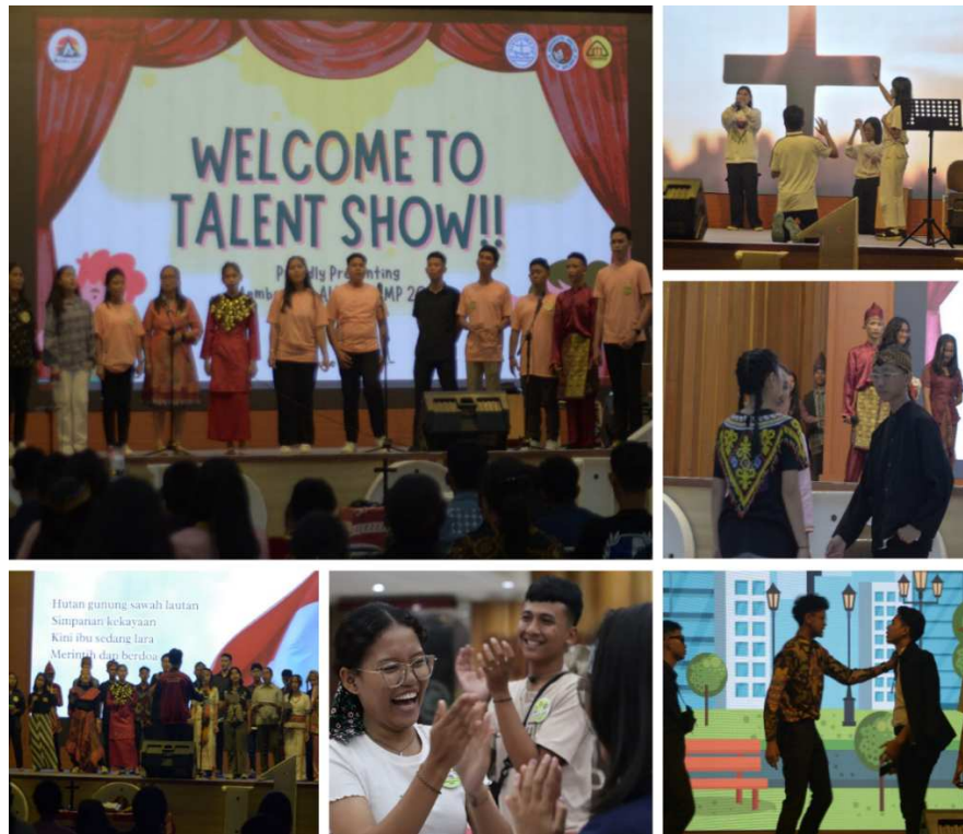
Gambar 9. Talent Show di Gedung BU UKSW

Selanjutnya, rangkaian akhir kegiatan di hari ini adalah seremoni penutup di Balairung Utama UKSW. Seluruh peserta menampilkan talent show yang telah dipersiapkan dalam kelas minat bakat dan juga melaksanakan rangkaian ibadah penutup. Hadir dalam kegiatan ini dari pihak UKSW adalah Wakil Rektor Bidang Keuangan, Infrastruktur dan Perencanaan (WR KIP) untuk menyampaikan sambutan penutup sekaligus apresiasi bagi seluruh pihak yang berkontribusi mendukung kegiatan Alpha Camp tahun 2024. Ibadah penutupan kegiatan ini dapat dilakukan streaming melalui kanal YouTube pada link :