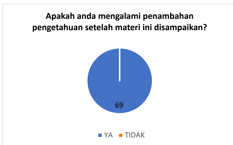
Gambar 12. Tingkat penambahan pengetahuan selama Alpha Camp

Dari grafik diatas, 41% responden memilih opsi sangat memuaskan, 48% responden memilih opsi memuaskan, dan 11% responden memilih cukup memuaskan, sedangkan untuk opsi tingkat kepuasan 1 dan 2 masing-masing 0%. Selain itu, terkait ada tidaknya pengetahuan baru yang didapatkan oleh para peserta selama kegiatan pengabdian berlangsung mendapatkan respon 100% peserta YA sebagaimana yang ditunjukkan pada Gambar 12. Berbagai temuan dari survei yang dilakukan ini menunjukkan bahwa kegiatan Alpha Camp yang difasilitasi oleh UKSW memberikan kepuasan dan kontribusi pengetahuan kepada peserta.