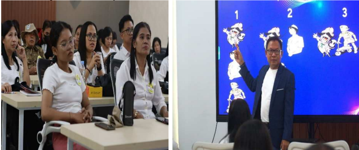
Gambar 5. Sesi materi bagi para pendamping di kampus UKSW

Peserta remaja melanjutkan sesi di siang hari dengan kelas-kelas minat dan bakat tahap 1, dimana Campus Ministry menjadi penanggung jawab bagi sesi ini. Seluruh peserta remaja dibagi ke dalam berbagai kelompok sesuai dengan bakatnya masing-masing dan diberi pengarahan dan pengajaran oleh Tim Campus Ministry UKSW, terbentuk kelas-kelas berdasarkan konsep talent show , sementara pendamping mengikuti sesi menerapkan disiplin positif dalam pembinaan remaja.