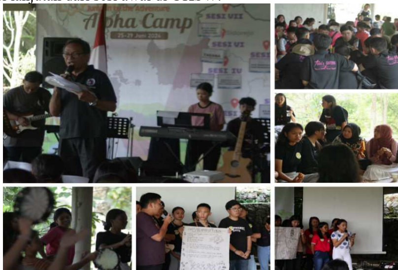
Gambar 7. Aktivitas pada hari ketiga didampingi di CM UKSW

Pada tanggal 27 Juni 2024, kegiatan Alpha Camp berlangsung di Hotel D'Emmerick. Universitas Kristen Satya Wacana terlibat dalam satu sesi yakni kelas minat bakat tahap 2, yang merupakan sesi lanjutan dari sesi awal di UKSW.