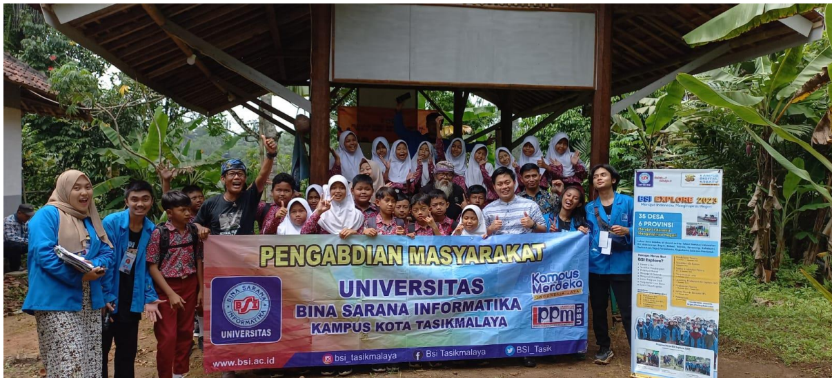
Gambar 4. Dokumentasi Terakhir Bersama Siswa/i dan Tamu Undangan