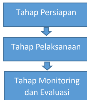
Gambar 1. Tahapan Pelaksanaan Pengabdian Masyarakat