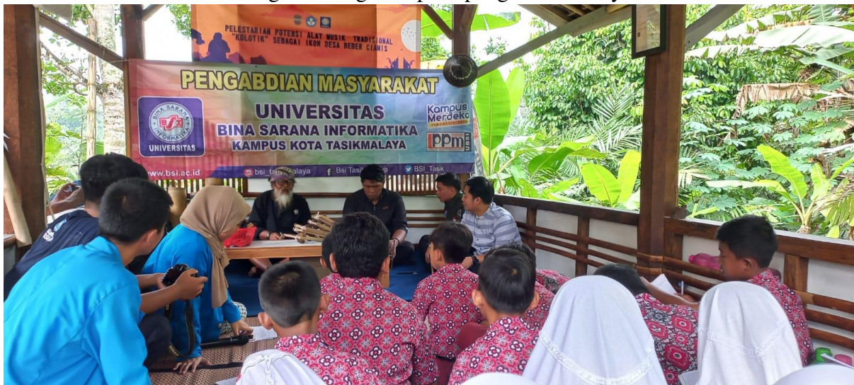
Gambar 1. Dokumentasi pembukaan oleh moderator

Berikut ini adalah rangkaian kegiatan pada pengabdian masyarakat.