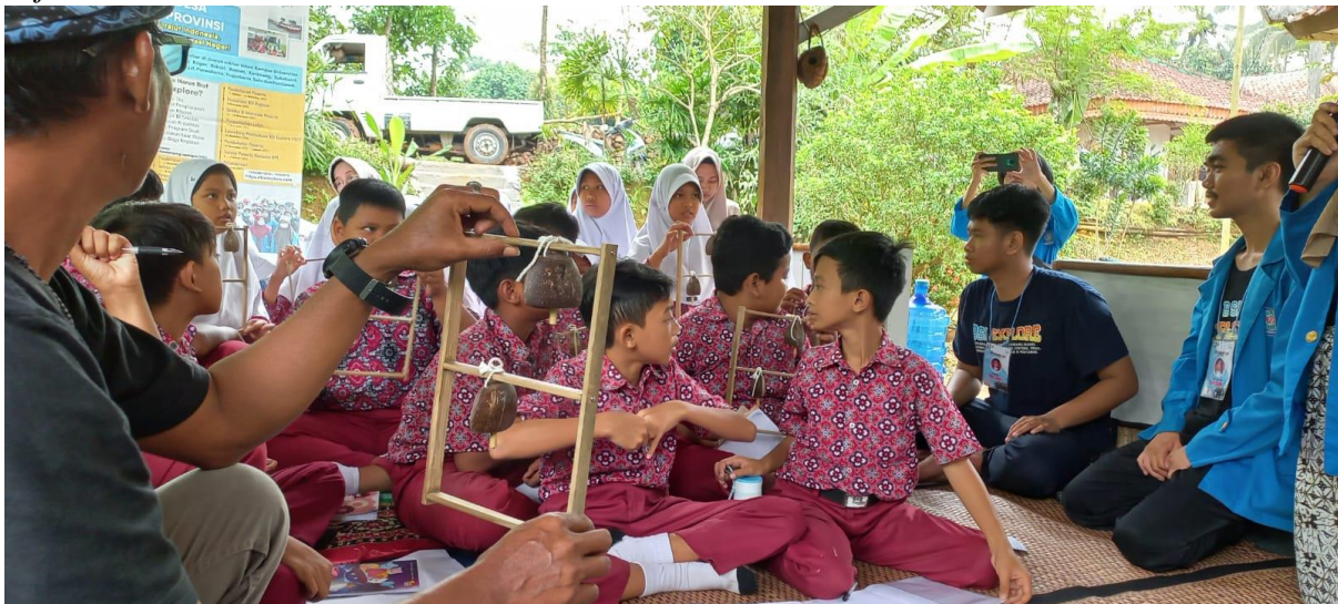
Gambar 3. Dokumentasi Peserta Saat Menyimak Materi

Pada gambar 3 adalah penyampaian materi Abah Nani. Materi yang disampaikan tentang Sejarah Kolotik .