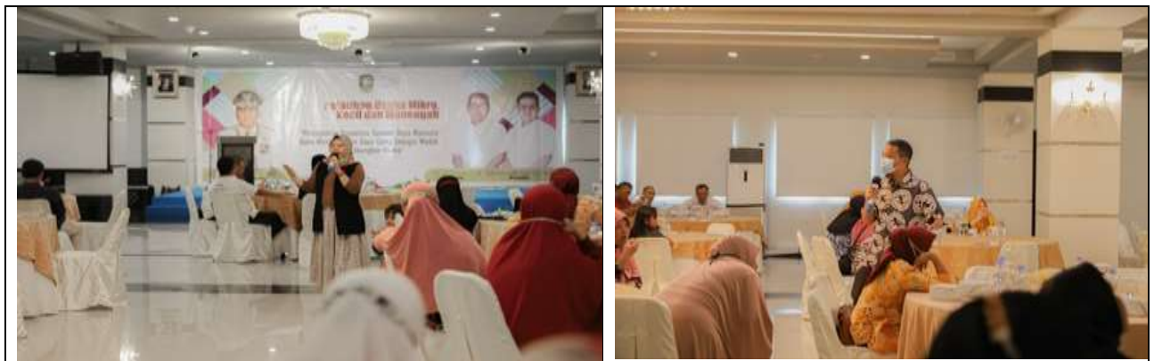
Tabel 1. Gambar Kegiatan Pengabdian

Kebutuhan solusi terkait permasalahan daya saing usaha tidak akan nana habisnya. Peran banyak pihak diantaranya pemerintah dapat meminimalkan masalah-masalah yang ada pada pelaku usaha. Oleh karena itu, kegiatan ini mendapat dukungan dari berbagai pihak untuk meningkatkan daya saing dan memberikan solusi permasalahan yang dialami pelaku usaha. Situasi saat pelaksanaan kegiatan Kegiatan pengabdian masyarakat ini berbasis partisipasi aktif dan sharing session antara narasumber dan peserta pengabdian. Kolaborasi yang menarik dalam penyampaian materi oleh narasumber membuat peserta pengabdian memiliki rasa ingin tahu yang tinggi dalam memotivasi berwirausaha. Interaksi yang penuh kesederhanaan ketika ada peserta yang bertanya dan kemudian dijelaskan oleh narasumber membuat peserta meningkat rasa percaya diri. Hasil evaluasi kegiatan pengabdian, diberikan kepada peserta dalam bentuk kuesioner setelah selesainya kegiatan penjelasan materi. Hasil evaluasi dapat dilihat pada tabel 1.