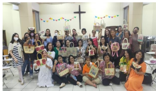
Gambar 4a,4b. Foto Bersama Panitia dan Peserta

Pelatihan pembuatan tas decoupage yang diberikan ini akan menambah keterampilan para ibu-ibu, remaja, dan pemuda. Dengan memberikan tambahan keterampilan maka peserta bisa mengelaborasi dirinya dan keahlian dalam berkreasi sehingga menjadi manfaat untuk melatih bakat dan menghasilkan barang yang berkualitas yang dapat dijual dan menambah pendapatan perekonomian setiap keluarga. Keahlian sederhana tetapi tidak kalah up to date dengan kreasi sekarang yang dapat meningkatkan nilai jual produk tas yang banyak diminati oleh kaum wanita. Gaya dan kreasi yang kekinian akan dapat menambah peminat tas anyaman menjadi tas yang elegan dengan mengangkat unsur imajinatif (Indriastuti et al. , 2019).