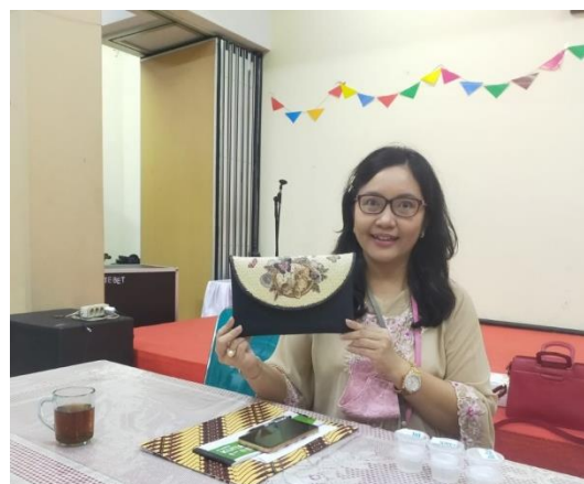
Gambar 5. Hasil Kerajinan Tas Decoupage