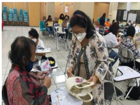
Gambar 3. Pelatihan Pembuatan Tas Decoupage oleh Pengajar

Pembuatan kerajinan decoupage ini dimulai dengan menggunting tisu dengan beragam bentuk, seperti bunga, kupu-kupu, buah, hewan, bintang, kotak. Selanjutnya melepaskan tisu pertama dan kedua sehingga hanya tinggal tisu pertama yang bergambar, wadah atau tas yang sudah disiapkan diberi lem dan ditempelkan tisu bergambar, saat lem setengah kering tisu tersebut ditempelkan dengan rapi agar media tidak berkerut, dan tunggu sampai mengering. Setelah kering media tas pandan dilapisi oleh pernis dan dapat diulang beberapa kali sehingga menghasilkan tas yang berkilau dan indah dilihat. Hingga tahap terakhir adalah keringkan kembali. Setelah kering tas dan dompet siap dikemas dan dijual (Sulistyowati et al. , 2018).