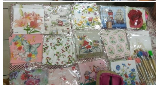
Gambar 2a,2b. Rapat Persiapan Pelaksanaan Kegiatan Pembuatan Tas Decoupage