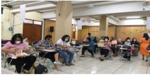
Gambar 1. Pelaksanaan Pembuatan Tas Decoupage