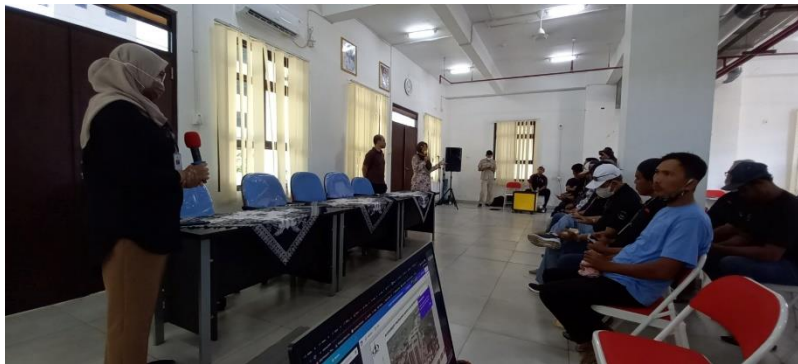
Gambar 1. Pelaksanaan kegiatan PKM di Ruang Serbaguna Rusunawa Rorotan IV

Kegiatan perencanaan titik kumpul dan jalur evakuasi pada lingkungan Rusunawa Rorotan IV dilakukan secara luring di Ruang Serbaguna Rusunawa Rorotan IV, Jakarta Utara. Kegiatan dilaksanakan pada tanggal 29 Oktober 2022 dan 12 November 2022. Sasaran adalah perwakilan warga dan pengelola Rusunawa Rorotan IV. Kegiatan dihadiri oleh 57 peserta. Sebelumnya, tim pelaksana dari Jurusan Arsitektur FTSP Universitas Trisakti pernah melakukan kegiatan PkM serupa dengan judul Pencegahan Kebakaran pada Lingkungan Permukiman Padat di Kelurahan Krendang, Kecamatan Tambora, Jakarta Barat. Pada kegiatan tersebut, telah direncanakan perencanaan jalur evakuasi dan titik kumpul yang dilakukan secara partisipatori (Madina dkk., 2019).