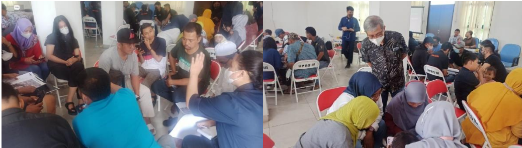
Gambar 3. Suasana FGD menentukan lokasi titik kumpul pada denah kawasan

Selanjutnya, tim melakukan analisis dan mempersiapkan gambar peta titik kumpul dan jalur evakuasi yang merupakan rangkuman hasil FGD. Titik kumpul yang diusulkan terdiri dari 7 titik kumpul dan diletakkan di area RPTRA, Amphiteater, PAUD, Plaza Penerima, Plaza Bazaar, Urban Farming dan Area Olah Raga Outdoor . Gambar peta dapat dilihat pada gambar 4. Antusiasme peserta, baik warga maupun pengelola Rusunawa Rorotan IV merupakan faktor pendukung kegiatan PkM dapat terlaksana dengan baik. Tidak ada penghambat kegiatan yang berarti dalam perencanaan maupun pelaksanaan kegiatan. Seluruh pihak yang terlibat, yaitu tim Jurusan Arsitekur FTSP Universitas Trisakti, Unit Pengelola Rumah Susun Rorotan IV dan para warga bekerja sama dengan baik dan saling mendukung. Sangat besar harapan warga bahwa peta titik kumpul dan jalur evakuasi dapat diimplementasikan pada lingkungan Rusunawa dan ada tindak lanjut dari pihak-pihak yang berwenang sehingga manfaat dapat dirasakan oleh lebih banyak warga.