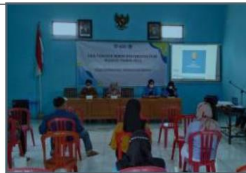
Gambar 3. Pelaksanaan Pelatihan & Pendampingan

usaha berdasarkan laporan keuangan yang telah disusunnya. Pada sesi ini, peserta cukup kesulitan untuk menentukan keputusan usaha dengan mempertimbangkan laporan keuangan UMKM. Hal tersebut karena peserta selama ini terbiasa menentukan keputusan hanya dari pengalaman dan kebiasaan mereka saja. Empat peserta mengakui bahwa selama menjalankan usaha mereka masih mencampuradukan keuangan usaha dan keuangan rumah tangga. Demikian sehingga berimbas pada penentuan keputusan usaha yang belum tepat. Sesi case study menjadi sesi terakhir pada tahap pelatihan, namun di kemudian hari dilakukan pendampingan kepada peserta secara mandiri di masing-masing tempat baik luring maupun daring by phone .