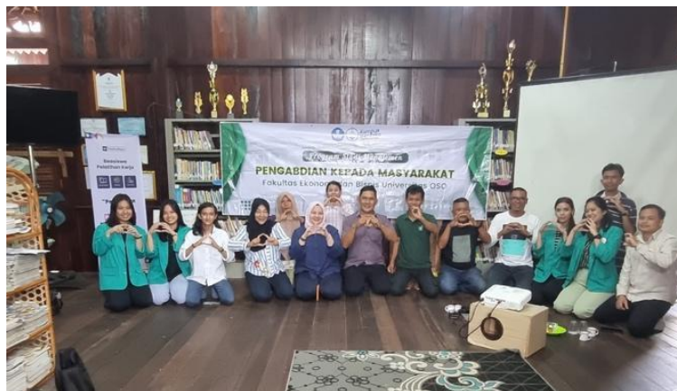
Gambar 2. Kegiatan Workshop di Desa Wisata Kampung Caping

Pelaksanaan kegiatan pengabdian di Kampung Wisata Caping, juga dikenal sebagai Kampung Mendawai, bertujuan untuk memberdayakan masyarakat lokal melalui pengembangan ekowisata yang berkelanjutan. Kegiatan ini melibatkan berbagai tahapan yang dirancang untuk meningkatkan kesadaran dan kapasitas masyarakat setempat dalam mengelola lingkungan, memperkenalkan teknologi wisata modern, serta menciptakan potensi ekonomi baru melalui sektor pariwisata berbasis ekosistem Sungai Kapuas. Pelaksanaan program ini juga difokuskan pada pemanfaatan sumber daya lokal, seperti budaya dan kearifan lokal, yang dapat mendukung pariwisata yang inklusif dan berkelanjutan.