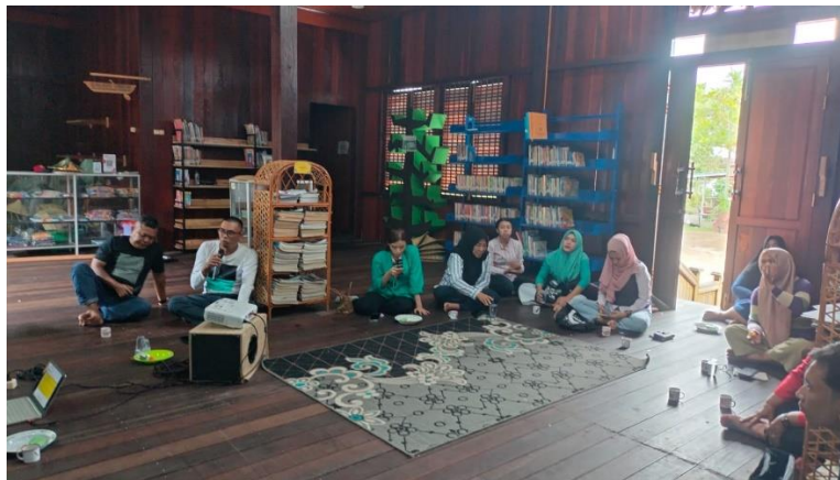
Gambar 3. Masyarakat di Desa Wisata Kampung Caping

Kegiatan workshop dan pelatihan ekowisata dilaksanakan dengan fokus pada generasi Z, yang merupakan kelompok usia yang memiliki ketertarikan tinggi terhadap teknologi dan isu-isu lingkungan. Workshop ini memberikan pengetahuan dasar tentang konsep ekowisata berkelanjutan dan bagaimana mengembangkan kawasan wisata dengan tetap menjaga kelestarian lingkungan dan budaya lokal. Selain itu, masyarakat diajak untuk memahami pentingnya manajemen sampah yang lebih modern dan ramah lingkungan. Pelatihan diberikan terkait dengan pengelolaan Bank Sampah yang telah didirikan di Kampung Caping, sebagai langkah konkret untuk mengatasi masalah sampah dan mendukung program ekowisata. Dengan adanya Bank Sampah, masyarakat diharapkan dapat lebih sadar akan nilai ekonomi sampah yang dapat diolah atau didaur ulang menjadi produk yang bernilai jual.