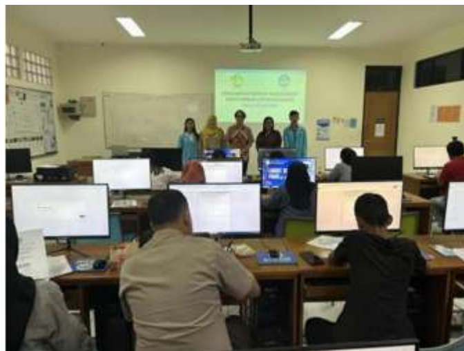
Gambar 3. Pre Test dan Post Test

Dengan pencapaian tersebut, tingkat ketercapaian keseluruhan kegiatan diestimasikan mencapai 90%, berdasarkan gabungan indikator kuantitatif dan kualitatif.