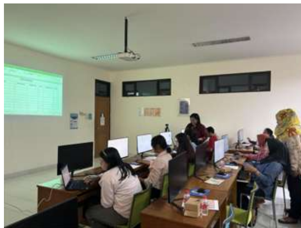
Gambar 1. Pelaksanaan PKM

Dari sisi sosial organisasi, digitalisasi ini menciptakan budaya kerja kolaboratif di antara pengurus. Sebanyak 90% peserta mengaku kini terbiasa bekerja secara daring dan saling berbagi dokumen melalui sistem cloud. Keberhasilan ini menunjukkan bahwa transformasi digital di lembaga sosial dapat dilakukan dengan pendekatan yang sederhana, selama disertai pelatihan yang aplikatif dan berorientasi pada kebutuhan riil.