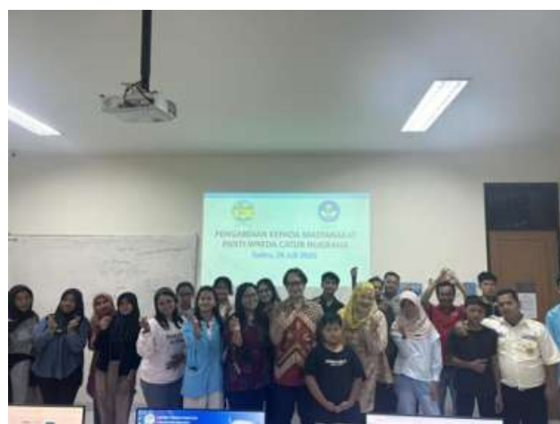
Gambar 2. Foto Bersama Pelaksanaan PKM