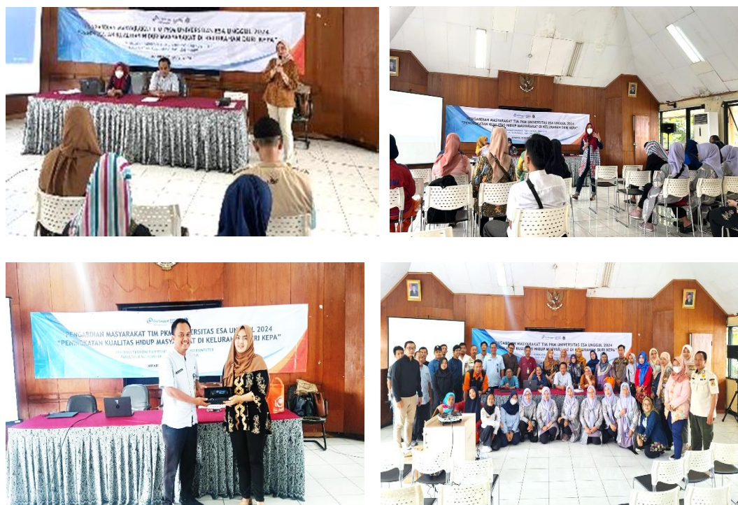
Gambar 2. Dokumentasi saat PKM dilaksanakan

Pemaparan materi terakhir sekaligus sebagai penutup mengenai pentingnya sebuah UMKM melakukan pencatatan dan pembuatan laporan keuangan serta pajak. Masyarakat Duri Kepa memiliki keragaman bidang usaha keluarga, salah satunya adalah menjadi pelaku usaha UMKM, jadi dalam kegiatan ini diharapkan dapat membantu para pelaku usaha UMKM dalam menjalankan usahanya. Berikut beberapa dokumentasi saat PKM dilakukan.