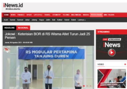
Gambar 4 Headline News Inews.id (sumber www.inews.id )

nya, seringkali membuat penulis ataupun pembuat V Update lainnya sulit untuk menemukan berita yang sesuai dengan spesifikasi berita yang dapat ditayangkan ataupun kehabisan berita dengan news value yang cukup. Jika hal tersebut terjadi, maka penulis ataupun pembuat V Update lainnya diizinkan untuk memasukkan berita yang memiliki nilai berita yang kurang.