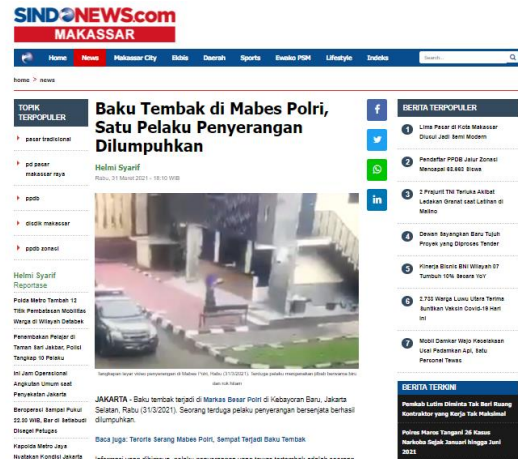
Gambar 3 Contoh Berita Sensitif

berita dari MNC serta telah dirilis di portal berita MNC Group maka radio-radio yang berada di bawah naungan MNC Radio Network dapat menyiarkan berita tersebut salah satunya di V Update yang ada di V Radio Jakarta.