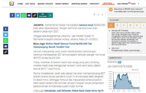
Gambar 1 Contoh Hard News