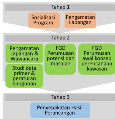
Gambar 3. Diagram Tahapan Pelaksanaan Kegiatan Pengabdian Masyarakat Perencanaan Partisipatif Kawasan Embung Sendangtirto