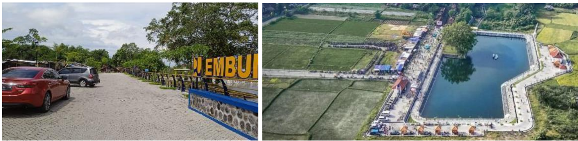
Gambar 1. Kondisi Kawasan Embung Sendangtirto

tersebut terdapat beberapa fasilitas, yaitu: bangunan satpam, ruang pertemuan (pendopo dan beberapa gazebo kecil), toilet dan bak penampung air serta beberapa lapak warung makan milik warga masyarakat (pengamatan lapangan, 2022). Pengembangan aktivitas wisata di sekitar Embung Sendangtirto dinilai memiliki potensi besar. Oleh karena itu, Pemerintah Kalurahan Sendangtirto merasa perlu segera merumuskan perencanaan kawasan yang berorientasi pada pembangunan yang berkelanjutan ( sustainable development ). Kegiatan pengabdian pada masyarakat ini bertujuan untuk mengimplementasikan perencanaan berbasis partisipatoris dan inovatif untuk dapat mendukung program pemerintah Kalurahan Sendangtirto.