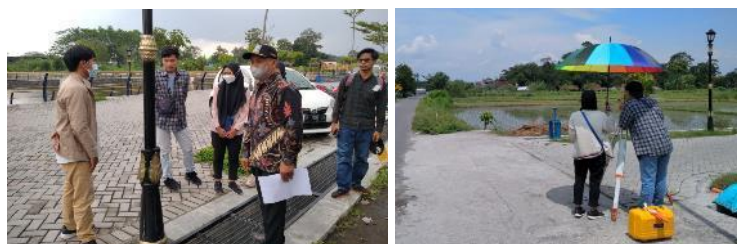
Gambar 5. Kegiatan persiapan dan pengukuran lapangan Kawasan Embung Sendangtirto

Selanjutnya pada tanggal 21 April 2022, dilakukan Koordinasi persiapan pengukuran lokasi. Penentuan batas persil kapling tanah, penyamaan persepsi antara gambar dan kondisi di lapangan. Kegiatan ini dihadiri oleh tim asisten mahasiswa Prodi Teknik Sipil UTY. Menyertai kegiatan lapangan juga dari bapak Carik (sekretaris desa) Kelurahan Sendangtirto. Pengukuran