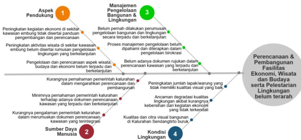
Gambar 2. Diagram Akar Masalah Kegiatan Pengabdian Masyarakat

Perencanaan kawasan berupa masterplan Kawasan Embung Sendangtirto ini diharapkan dapat menjadi arahan pengembangan potensi wisata dan ekonomi kawasan yang terintegrasi, mengakomodasi ruang terbuka publik yang ramah anak dan lansia, serta mempertimbangkan potensi alam serta menjaga kelestarian sumber daya air.