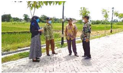
Gambar 4. Koordinasi awal dan peninjauan lapangan