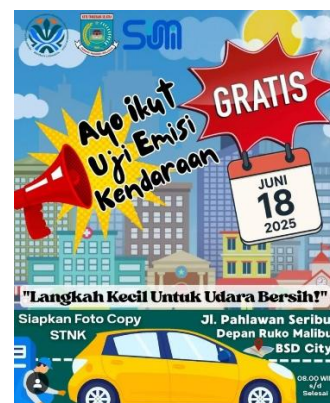
Gambar II. Poster Sosialisasi Kegiatan Uji Emisi Kendaraan Gratis oleh DLH Kota Tangerang Selatan

Responsivitas Dinas Lingkungan Hidup (DLH) Kota Tangerang Selatan dalam pengendalian pencemaran udara terlihat dari upaya merespons kebutuhan masyarakat, baik melalui program pemantauan maupun penanganan pengaduan. Namun, keterbatasan anggaran dan sumber daya membuat responsivitas belum sepenuhnya optimal. Pemantauan kualitas udara hanya dapat dilakukan dua kali setahun, sehingga DLH tidak leluasa melakukan pengujian insidental ketika terjadi lonjakan polusi mendadak. Selain itu, laboratorium internal belum berfungsi maksimal karena keterbatasan SDM dan sarana prasarana. Kondisi ini menunjukkan adanya keterbatasan respons DLH terhadap dinamika lingkungan yang bersifat tidak terduga.