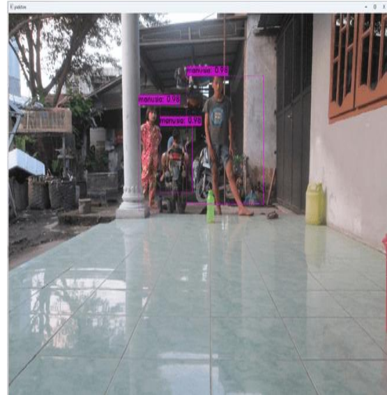
Gambar 9. YOLO Mendeteksi Tiga Objek Manusia

Pada gambar 7 memperlihatkan YOLO dapat mendeteksi objek manusia pada duduk ditandai dengan berhasilnya YOLO membentuk bounding box warna merah pada objek manusia tersebut.