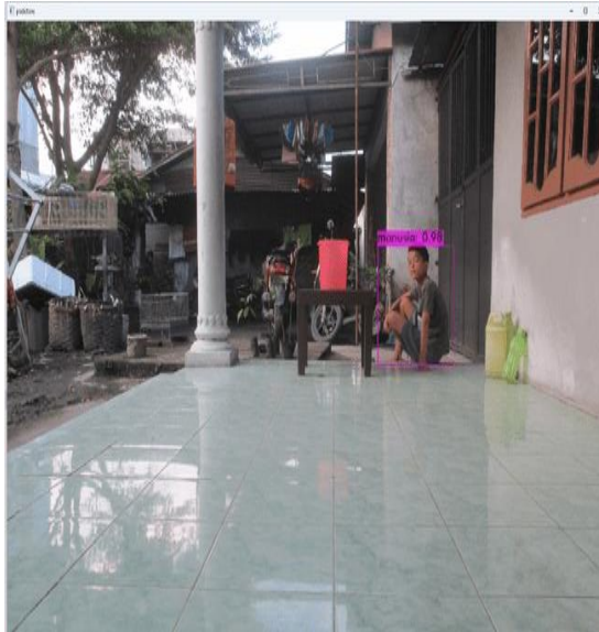
Gambar 7. YOLO Mendeteksi Objek

Pada gambar 7 memperlihatkan YOLO dapat mendeteksi objek manusia pada duduk ditandai dengan berhasilnya YOLO membentuk bounding box warna merah pada objek manusia tersebut.