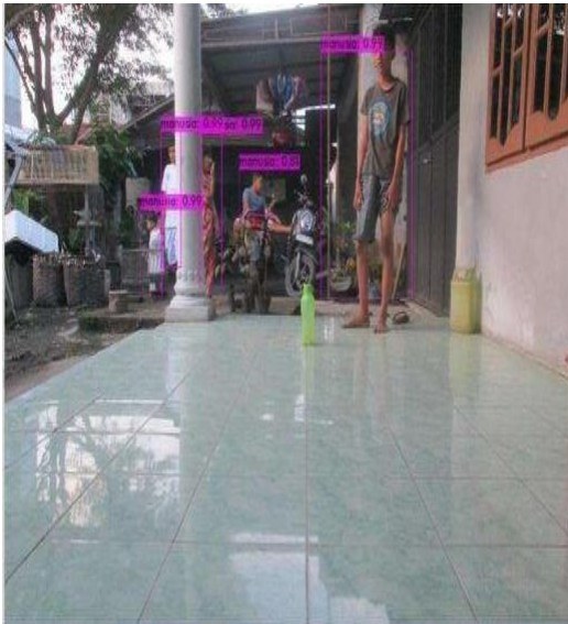
Gambar 11. YOLO Mendeteksi Lima Objek Manusia

Pada gambar di atas YOLO dapat mendeteksi lima objek manusia pada posisi berdiri, duduk dan berbagai tinggi dengan nilai mean average precision (mAP) masing- masing 0,81 dan lainnya 0,99 yang ditandai dengan berhasilnya YOLO membentuk bounding box warna merah pada lima objek manusia tersebut.