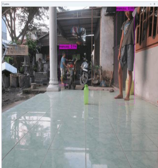
Gambar 8. YOLO Mendeteksi Dua Objek Manusia

Gambar 9 merupakan pengujian YOLO yang dapat mendeteksi tiga objek manusia dengan nilai mAP masing-masing 0,98 dan ditandai dengan berhasilnya YOLO membentuk bounding box warna merah pada tiga objek manusia.