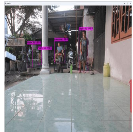
Gambar 10. YOLO Mendeteksi Empat Objek Manusia

Pada gambar 8 YOLO dapat mendeteksi dua objek manusia pada posisi berdiri dengan nilai mean average precision (mAP) masing-masing 0,94 dan 0,99 dan ditandai dengan berhasilnya YOLO membentuk bounding box warna merah pada dua objek manusia tersebut.