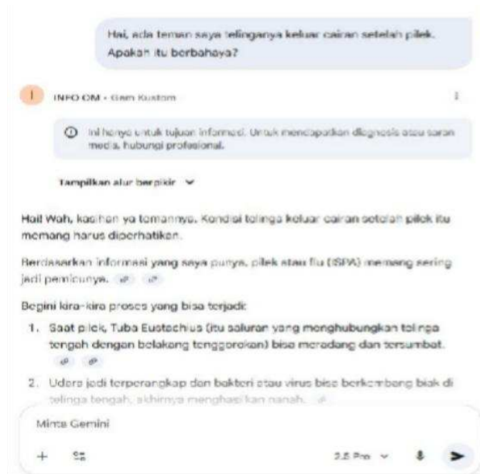
Gambar 5. Tampilan obrolan dan respon jawaban purwarupa konseptual Chatbot info OM