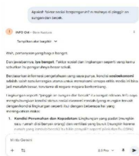
Gambar 5. Tampilan obrolan dan respon jawaban purwarupa konseptual Chatbot info OM