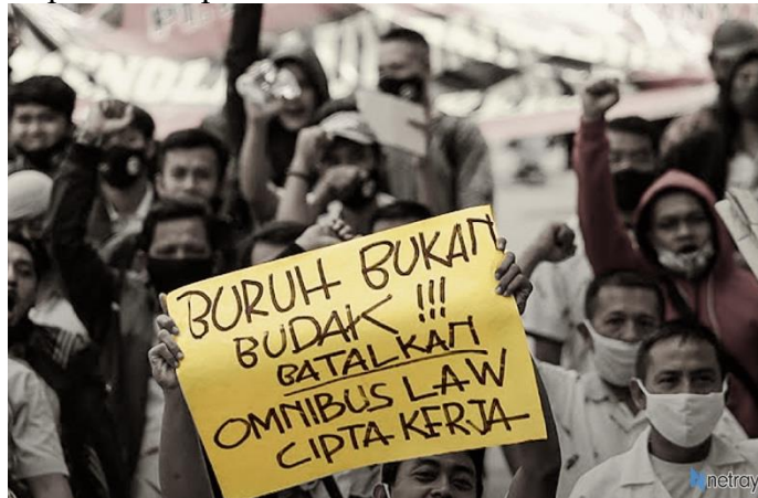
Gambar 7. Isu Aksi Protes UU Cipta Kerja, Otokritik Kelas Pekerja

Pemerintahan Presiden Jokowi telah mengalami peristiwa yang berhubungan dengan pembatasan ruang kritik. Meskipun Jokowi dikenal sebagai seorang pemimpin yang lebih terbuka dibandingkan pemerintahan sebelumnya, kritik terhadap kebijakan seperti UU ITE dan peristiwa pengesahan UU Cipta Kerja tidak pernah digubris, serta kasus lain seperti Revisi UU KPK juga berjalan pada periode pemerintahan Presiden Jokowi. Lukisan ini bisa dianggap sebagai respon terhadap kebijakan-kebijakan tersebut yang sering dipandang sebagai bentuk ketidaksetaraan dalam distribusi kekuasaan atau marginalisasi kelompok-kelompok tertentu.