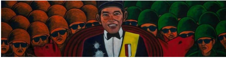
Gambar 4. Lukisan “Konoha I” oleh Yos Suprpto di tahun 2024

Kehadiran banyak tentara dalam lukisan ini pada gambar 4 juga berfungsi untuk mengkritik gambaran prajurit yang ideal. Tentara dalam lukisan ini menggambarkan dampak negatif dari kekuasaan yang dilindungi oleh militer (Murray, 2014). Dalam konteks ini, tentara melambangkan seorang pemimpin otoriter yang dilindungi oleh militer di belakangnya, yang dengan kekuatan fisik dapat memaksa rakyat untuk tunduk kepada penguasa tersebut. Tentara berfungsi sebagai simbol dominasi dan represi yang diimplementasikan oleh kekuasaan yang otoriter.