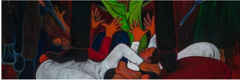
Gambar 2. Lukisan “ Konoha I ” oleh Yos Suprpto di tahun 2024

Tokoh utama yang duduk di kursi besar memperlihatkan kekuasaan mutlak, terpisah jauh dari rakyat yang terinjak di bawahnya, menggambarkan hierarki sosial yang jelas. Menurut Liang & Cho (2022) penggunaan garis-garis tajam dan bentuk yang tegas memberikan kesan kekuatan dominan yang muncul dari objek utama, serta menggambarkan ketidaksetaraan antara penguasa dan rakyat.