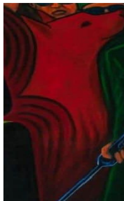
Gambar 3. Lukisan “ Konoha I ” oleh Yos Suprpto di tahun 2024

Gerakan tangan yang terkunci di bawah kursi pada gambar 2 menggambarkan pengekangan dan introspeksi. Hal ini merepresentasikan perjuangan internal rakyat, serta hubungannya dengan situasi sosial, politik, dan budaya sekitar (Wang, 2007). Bagian ini mengkritik struktur politik yang menindas rakyat melalui simbolisme yang ada dalam lukisan tersebut.