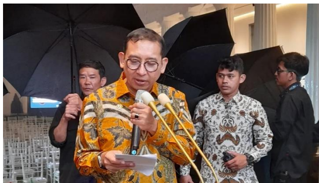
Gambar 8. Fadli Zon Bantah Ada Pembredelan di Pembatalan Pameran Tunggal Yos Suprpto

Pameran ini memperlihatkan ketegangan yang ada antara kebebasan seni dan kontrol politik. Beberapa pihak mendukung pembatalan pameran dengan alasan untuk mencegah ketegangan lebih lanjut, sementara yang lain menganggap pembatasan tersebut sebagai bentuk pembatasan kebebasan berekspresi. Menurut Özcan, O. (2022), konteks kebebasan berekspresi melalui seni sering kali dibatasi oleh kekuasaan yang takut akan kritik sosial yang diciptakan oleh rakyat yang kecewa dengan penguasa. Reaksi ini mencerminkan adanya ketegangan yang dalam antara kebebasan seni dan kontrol politik yang ketat. Di sisi lain, pembatalan pameran ini juga membuka diskusi lebih dalam mengenai peran seni sebagai kritik terhadap otoritarianisme dan bagaimana kekuasaan berusaha untuk membatasi ekspresi yang berpotensi mengancam struktur kekuasaan yang ada.