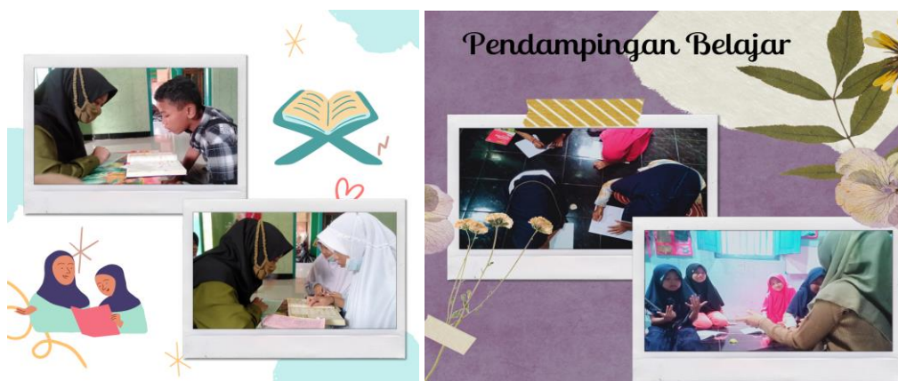
Gambar 4 Mendampingi Belajar Anak

materi pilihan mereka sendiri sesuai kebutuhan anak-anak karena mereka merasa kurang paham jika di jelaskan secara online sehingga membutuhkan pendampingan. Kegiatan ini dapat berjalan dengan baik dan lancar. Agar lebih jelas dalam memahami materi, mereka harus di jelaskan lebih dari dua kali baru bisa benar-benar paham. Kegiatan ini sangat membantu anak-anak memahami materi yang dianggap sulit dan membantu para orangtua yang tidak punya waktu dikarenakan sibuk bekerja. Kegiatan mendampingi anak-anak belajar memiliki dampak yang sangat positif di mana orangtua yang tidak punya waktu dikarenakan sibuk bekerja dan tidak bisa menjawab pertanyaan anaknya merasa terbantu dengan kegiatan pengabdian, karena jika adik-adik tidak bisa menjawab tugas yang telah di berikan oleh sekolah adik-adik boleh kerumah saya untuk bertanya mengenai tugas tersebut.