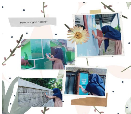
Gambar 1 Pemasangan Pamflet

Selanjutnya sosialisasi bagaimana cara menggunakan masker dengan baik dan benar kepada ana-anak. Tujuannya agar anak-anak tidak asal-asalan dalam menggunakan masker sehingga mengantisipasi penyebaran virus Covid-19. Adapun cara menggunakan masker yang baik dan benar yaitu menentukan terlebih dahulu mengenai bagian luar dan dalam, dimana bagian luar merupakan bagian yang berwarna sedangkan bagian dalam merupakan bagian yang berwarna putih. Kemudian menentukan bagian atas dan bagian bawah, bagian atas memiliki ciri yang didalamnya terdapat sebuah kawat. Kaitkan tali masker ke telinga, kemudian bagian yang memiliki kawat di letakkan di atas kemudian kawat tersebut ditekan ke hidung sehingga tidak menyisakan celah, kemudian bagian bawah ditarik sampai ke dagu sehingga menutupi hidung sampai dagu (ditpsd.kemendikbud.go.id, 2021)