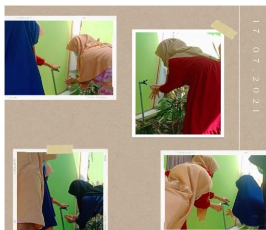
Gambar 3 Mencuci Tangan

Kegiatan sosialisasi cara mencuci tangan dengan benar dan baik kepada anak-anak memiliki dampak yang sangat positif, dimana biasanya jika mencuci tangan anak-anak hanya membasahi tangannya dengan air, dengan sosialisasi yang diberikan, anak-anak mencuci tangan dengan benar karena mereka tau bagaimana pentingnya mencuci tangan di air mengalir dan menggunakan sabun dengan langkah-langkah yang benar akan mencegah penyebaran Covid-19.