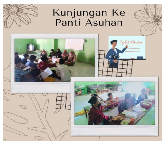
Gambar 6 Kunjungan ke Panti Asuhan

Kemudian beserta karang taruna mengunjungi panti asuhan. Pada kegiatan ini, memberikan materi tentang bahasa Inggris kepada anak-anak penghuni panti asuhan, yaitu mengenai vocab dan conversation mengenai benda-benda yang ada di kelas. Setelah itu masing-masing kelompok yang terdiri dari dua orang anak akan melakukan percakapan dengan bahasa Inggris. Kami juga mengadakan kuis untuk yang berani melakukan percakapan di depan kelas akan mendapat hadiah. Selain itu, kami juga memberikan sedikit makanan dan juga snack untuk anak-anak. Dari kegiatan ini anak-anak menjadi semangat untuk belajar bahasa Inggris, terlihat dari antusias dan meminta untuk rutin diadakan pendampingan.