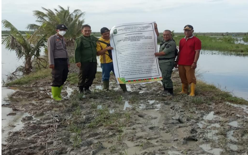
Gambar 1. Pemasangan Spanduk Larangan di Area Konflik