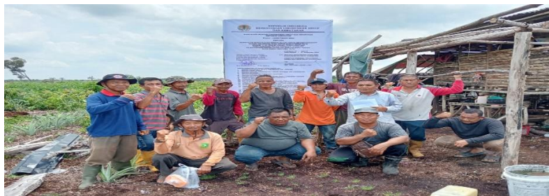
Gambar 3. Kelompok Tani Hutan Bagan Besar Jaya

hutan dan pemanfaatan ekonominya, diperlukan penerapan pola usaha dan teknik pengelolaan berbasis agroforestri. Pola ini mengintegrasikan tanaman kehutanan, tanaman pertanian, dan komoditas bernilai ekonomi, sehingga menciptakan sistem yang produktif, berkelanjutan, dan ramah lingkungan. Pemberian akses legal melalui HKM bukan hanya solusi konflik, melainkan juga fondasi bagi peningkatan kesejahteraan ekonomi dan keberlanjutan ekologis di tingkat tapak.